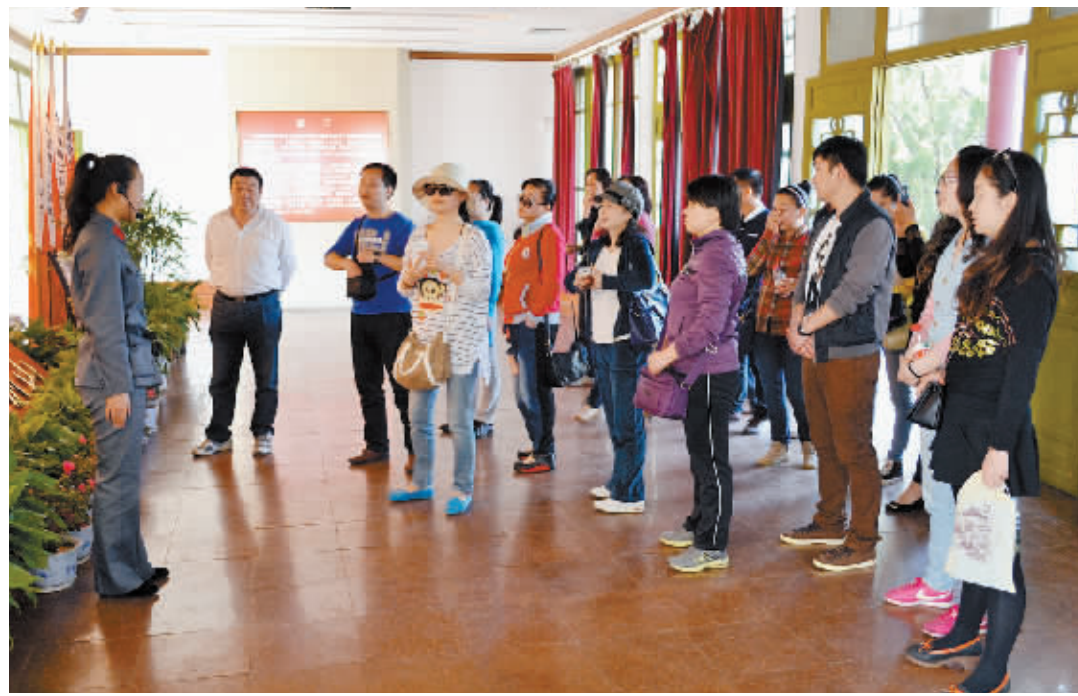
近日,市中心血站组织干部职工到新县红色革命教育基地参观学习。大家怀着无比崇敬的心情,先后参观了鄂豫皖苏区革命烈士纪念馆、鄂豫皖苏区首府革命博物馆、许世英将军故里等,共同追忆那段艰苦卓绝的革命岁月,缅怀先烈不怕牺牲、英勇奋斗的奉献精神。

民医院拟定了人才培养和技术支援方案。刘广芝表示,省人民医院将利用3年左右的时间,根据罗山县人民医院业务开展需要,创新对口支援方式,免费接收县医院人员进修培训,优先安排县医院转诊病人,并选派专家来县医院坐诊、带教和手术,力求使罗山县人民医院在医疗技术水平上有大的提升。