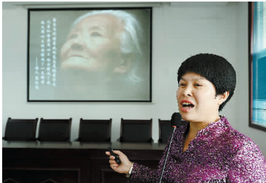
4月11日,一位志愿者在曲阜市小雪街道武家村道德讲堂为村民做《感恩父母》讲座。

郭书林同时表示,公众碰到新闻敲诈或有偿新闻等情况时,一是绝对不能采取私下送钱“摆平”的做法,否则违法人员尝到了甜头还会卷土重来,找机会继续敲诈勒索。二是要注意保存录音、录像、收据、发票、核稿函、传真、汇款凭证等各类证据,并及时向当地新闻出版广电行政管理部门或者是公安机关报案。总局设有新闻敲诈及假新闻举报电话:010-65212870,010-65212787,各省局近期也将再次公布举报电话。欢迎社会各界举报各类新闻出版广电违法违规行为并提供证据,我们将为举报者提供必要的保护。