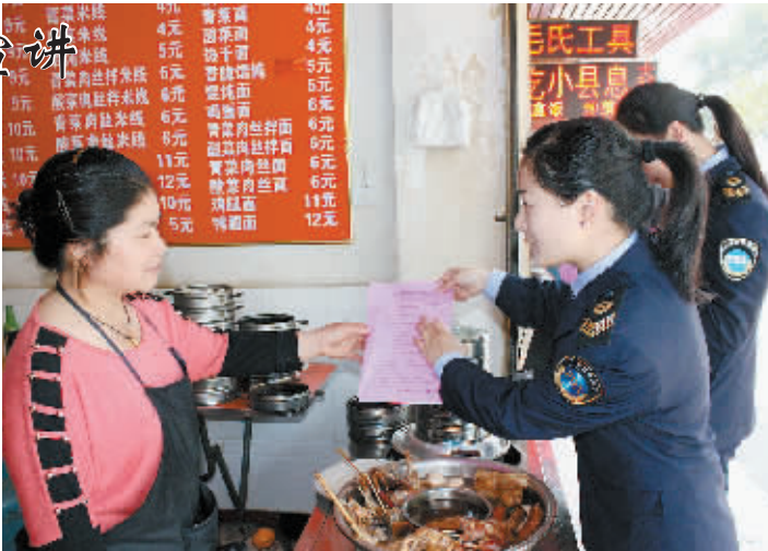
本报记者 赵锐 摄

4月4日上午,浙河区食品安全监管所的工作人员对火车站辖区的沿街小餐饮店进行“创卫”小餐饮规范达标的宣传。因为工作人员向沿街小餐饮店发放资料并热心宣讲相关知识。 本报记者 赵锐 摄