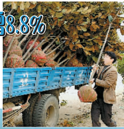
从2000年开始实施的河南省退耕还林工