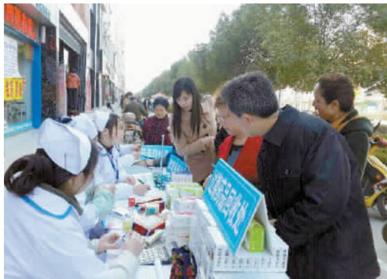
3月15日,信阳美锐大药房携手各名优药品生产厂家联合举办“免费回收家庭过期失效药品”活动。活动当天,就回收价值10万元的药品,并在药监部门的监督下,对回收的过期药品进行统一销毁。

据了解,该区从2月12日开始岗前培训以来,为产业聚集区的瑞孚实业、国泰恒广服饰、瑞麟制衣、南纬服装、豪客礼服、美森铝业、舜宇光学、丰泰铝业等企业培训新进员工共计3000多人。