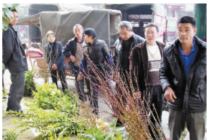
日前,罗山县青山镇苗木培育户开始在集镇出售桃树、梨树等10余种果树苗,吸引了过往居民的目光。