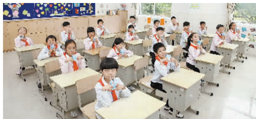
图为学生们在课间饮用“学生奶”。

许多家长都曾有过这样的疑问,“孩子在家常喝牛奶,为什么还要在学校里喝牛奶?”其实,受中国人饮食习惯等因素的影响,很多家长无法保证学生的早餐质量,相当比例的学生在上午第二节课后,都出现不同程度的血糖降低现象,从而影响到上课注意力和学习成绩,甚至影响了孩子的生长发育。此时,为学生们提供一包优质牛奶,不仅能适