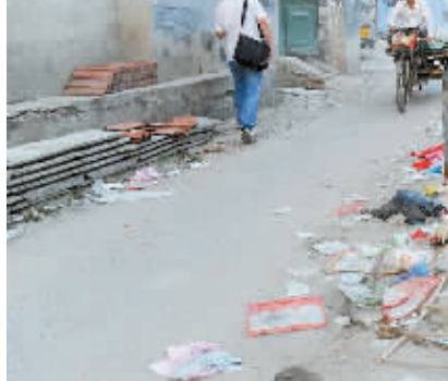
北京朝阳区金盏乡小店村内,路旁的垃圾堆随处可见。

位于北京东郊三区交界处的北神树垃圾填埋场,1997年投入使用,设计日处理垃圾能力980吨,设计使用寿命13年。然而直到今天,每天还有超过千吨来自北京中心城区的垃圾运到这里,再由专