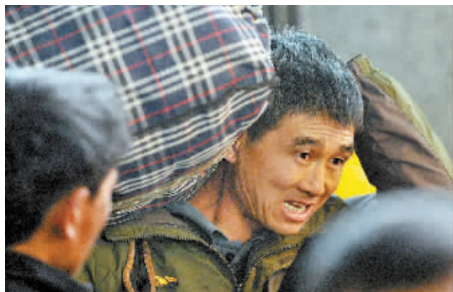
1月16日,在北京西站,身扛行李的旅客准备进站。