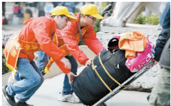
1月16日,志愿者在广西南宁火车站帮乘客推行李。