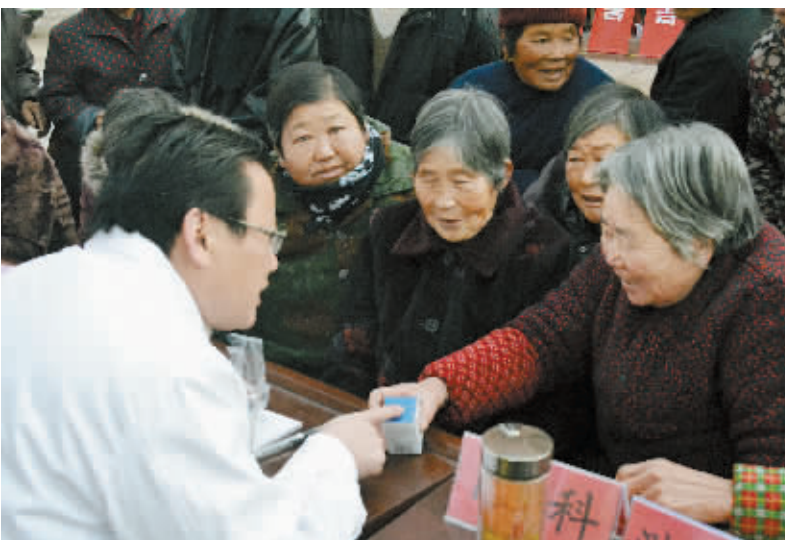
12月初,由商城县卫生局组织、商城县人民医院内科、外科、骨科、眼科的专家一行10余人等组成的卫生人才义诊队,走进上石桥、达权店等镇,与当地卫生院联合开展“服务发展、服务基层、服务群众”义诊活动,得到当地老百姓的热烈欢迎和积极响应。

作为招商引资单位,今年年初,平桥区卫生局通过多方努力,促成平桥区政府与深圳华鹏飞现代物流股份有限公司签订项目资金为1亿元的医药物流项目,在平桥辖区内注册成立医药配送公司开展医药经营及配送业务,进一步促进和推动平桥物流业和服务业的发展。9月份,平桥区卫生局又与生产新型环保材料的河南金联管业有限公司签订总投资4000万元的招商协议书。项目已落户平桥工业园,主要是生产PVC-U排水管材、PE给水管、PP-R给水管材等不同口径的农村安全饮水、自来水公司水网改造等项目管材用品,工厂一期四条生产线现已建成投产。