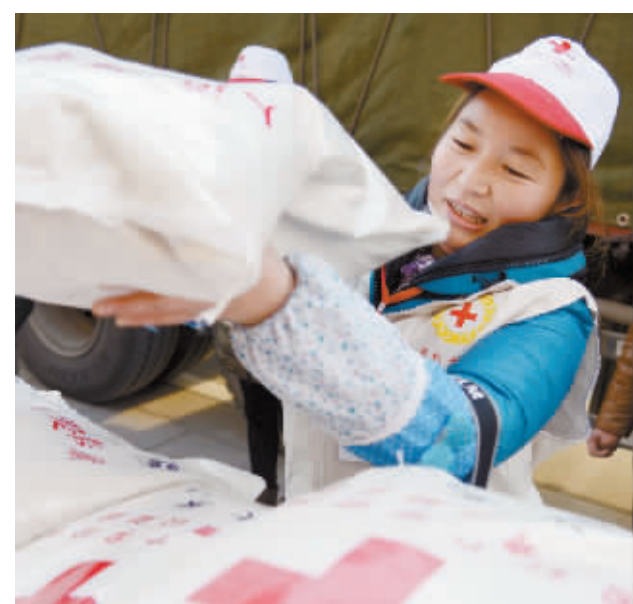
12月11日上午,中国红十字会向新县环卫爱心食堂捐赠优质大米21吨,总价值10万余元。图为环卫工人正高兴地领取爱心大米。

达到97%以上;以提升妇幼保健服务能力为契机,开展岗位练兵、技术比武、学术讲座、孕产妇产学校、专家带教等,医疗服务质量和水平明显提升;认真落实农村孕产妇分娩补助、口服叶酸预防神经管畸形及免费婚前医学检查等公共卫生项目,让群众真正得到实惠,享受“新医改”带来的福祉,树立了良好的社会形象。