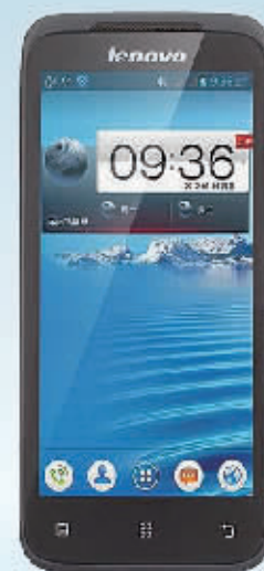
联想A398t 4.5英寸双核双卡