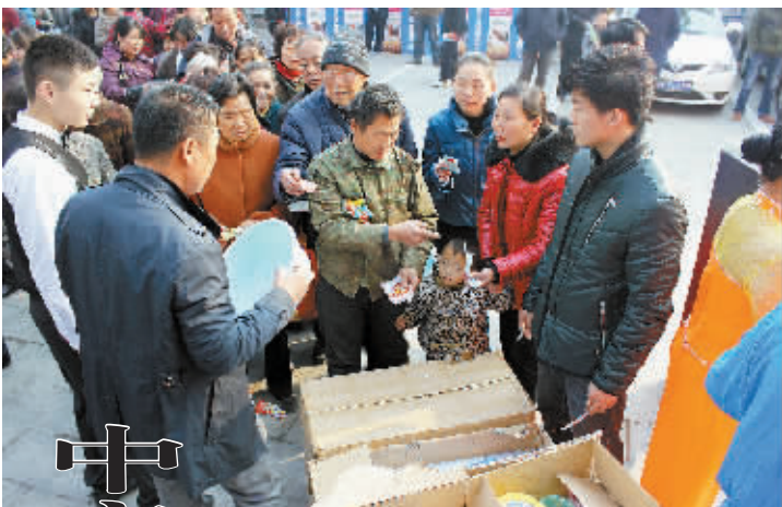
图为市民在排队领取免费奖品。

2014年越来越近,圣诞、元旦、春节“三节”的氛围已开始酝酿,在年末岁初之际,信阳移动一年一度的超值感恩回馈活动又已开启,推出了多项优惠活动,邀新老客户一起喜迎新年。 “每年新春期间移动的优惠活动我都会参加,无论是买手机还是存话费,优惠促销力度都很大”,陈先生是移动老客户,听说移动促销活动开始了,急忙赶到营业厅来办理,“5年了,我是移动的老客户了,我刚参加存话费送礼活动,用移动越久,回馈越高,存180元,移动送了100元的西亚购物卡,这就准备去买年货去!” 和陈先生的心态一样,绝大部分的移动客户都在参与移动新春促销活动,据了解,信阳移动目前客户超过300万,每年参与新春优惠活动的客户超过80%。就在此前,中国移动更换了全新的企业标志,推出了高达100M/秒的极速4G,又即将上市新的商业主品牌,移动这些举措的集中推出,也为移动客户和市民增添了新的憧憬。 “我想换个新款的手机过年,忙碌了一年也好好犒赏犒赏自己,一直在等移动的新春促销,最近看到了移动特价购机的消息,特别来挑选一款智能手机。”从事广告行业的唐先生如是说。 我们也从多方面打听信阳移动新春促销的活动内容,市场部有关人员介绍:“这次移动回馈活动含五大类,包括新人网送好礼,预存话费送好礼,存话费送手机,存流量送好礼,存宽带送话费等等。今年我们精心为客户准备了各种实用的礼品,包括购物卡、加油卡、食用油、大米、电饭煲、羊毛被、自行车等,希望能给信阳移动客户带来更加幸福美好的生活”。 (小易)