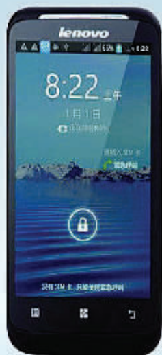
联想A308t 4英寸双卡双核