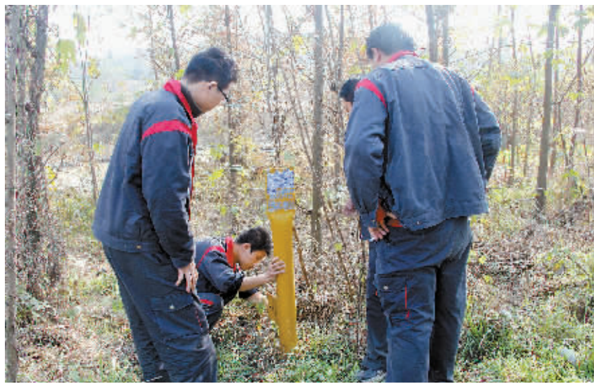
图为天然气管道巡线员工作时情景。