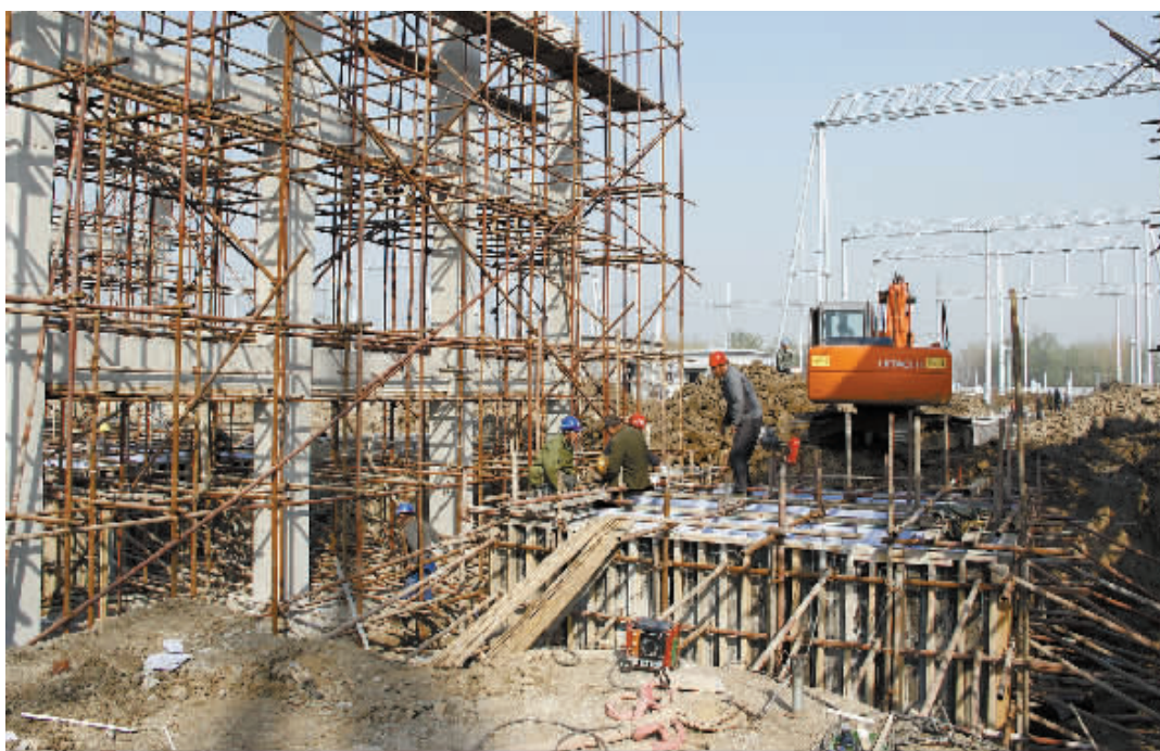
信阳东500千伏输电工程是省、市重点项目,是关系信阳经济社会发展和民生改善的重要工程。该工程建成后,可解决“十二五”中后期信阳地区500千伏主变容量紧张的问题,保障我市工农业生产、现代服务业发展和居民日益增长的用电需求。图为11月20日位于潢川县魏岗乡境内的信阳东500千伏变电站施工现场。

为进一步开展好农村“党员活动日”活动,李湘豫强调,要深化服务。加强基层服务型党组织建设,是党的十八大对新形势下基层党组织建设的新定位、新要求。因此,在开展“党员活动日”活动时,要把服务作为一条主线贯穿始终,通过形式多样的活动达到服务发展、服务群众、服务党员、服务民生的效果。要灵活多样。开展活动要坚持原则性与灵活性相结合,要让普通党员群众“点菜”,党组织来“做饭”,使主题选择和方案策划更加符合普通党员群众的意愿,做到活动主题、时间的灵活多样,真正起到联系基层、服务群众的作用,进而激发党员群众参加活动的兴趣和热情。要富有活力。要及时总结活动开展的成功经验并不断创新和完善,通过开展“回头看”,多听取党员群众的意见,把普通党员和群众的满意度作为检验活动的标准,不断提高活动的针对性和实效性,让“党员活动日”更加富有生机与活力,从而打造成一个响亮的党建品牌。