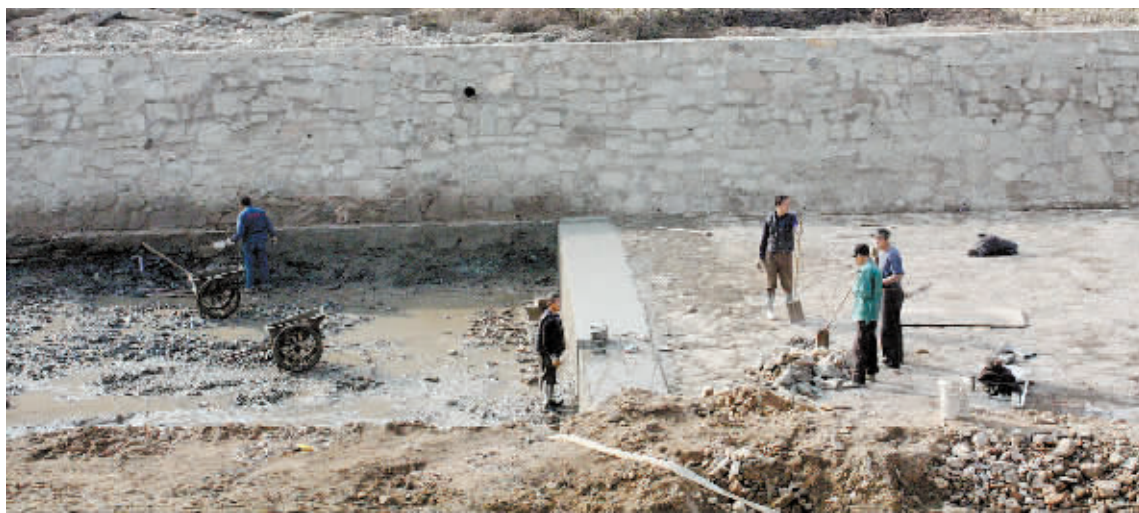
11月21日,工人在李家寨马河治理工程现场施工。该工程是南湾湖生态环境保护试点项目的一部分,共建设15个小型拦河坝,能有效净化上游河段的生活污水,减少污染物排入南湾湖。

市区外企业65家,牵线招商引资项目50余个,落地开工项目30余个,计划总投资约15亿元。