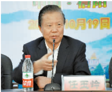
国务院参事任玉岭在研讨会上发表重要讲话