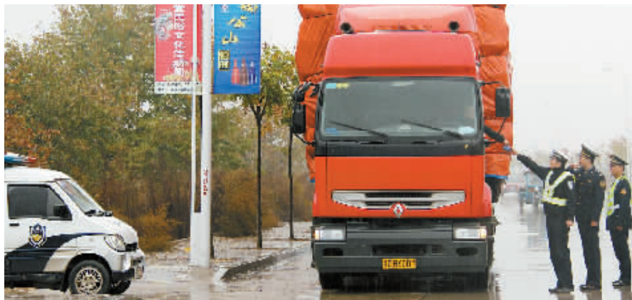
近日,因上天梯管理区境内跨宁西铁路大桥维修,一些运输矿产品重载车辆穿行我市中心城区,给辖区公路、桥梁和人民群众生命财产安全造成威胁。根据市政府主要领导要求,自11月1日开始,平桥区交通运输局联合交警部门开展为期60天的重点路段车辆超限超载运输集中整治活动。截至目前,联合执法人员共劝导重载运输车辆128台,查处超限超载车辆26台。图为联合执法人员正在检查运输车辆。