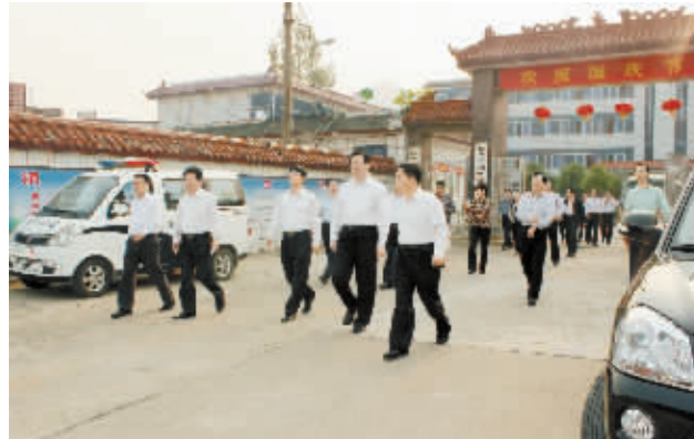
信阳市委书记郭瑞民到沂河港检查指导工作