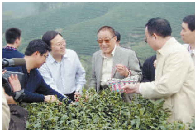
原中共中央政治局委员、中央军委原副主席曹国川视察沂河港茶产业基地

茶产业的发展也带活了茶旅游。沂河港镇境内拥有丰富的旅游景点,借助这个平台,该镇做大做优做强茶旅游文章,通过总体考察开发旅游景点,把马家畈、德茗茶社、文新三园、黑龙潭、白龙潭、何家寨、沂河港镇码头、仙女潭、白庙村银杏树、四望山、桃园集镇等作为重要旅游景点打造,请郑州河南城市规划设计院专家高标准设计融合绿色山水旅游和红色文化游的各项元素,创新营销模式,与旅游紧密结合,既促进茶产品的销售,又提升旅游内涵。打造旅游景点。一方面,按照科学规划,合理布局,集游、购、乐于一体,吃、住、玩相配套的要求,高起点规划、高标准建设功能完备,设施齐全,与茶乡特色相融合的新农村示范景区;另一方面,依托境内红绿及生态优势,结合茶园观光建设,打造一批茶文化园、茶文化生态体验馆等精品休闲旅游观光体验景点。通过景点打造,让游客有吃、有住、有玩、有乐。开辟旅游线路。着力整合“红茶”、“红色”、“绿茶”、“生态”资源,使红、绿、生态进行有机嫁接,开辟以茶园观光、茶叶现场制作、品茶购茶为主的休闲旅游体验游;以“黑龙潭瀑布、白龙潭瀑布、弥勒佛、擂鼓台、仙女潭瀑布、滴水岩瀑布、三仙缸”等神奇秀丽的自然山水风光生态景观游;以白云信阳红发源地、何家寨陆羽茶文化新村为主的红茶休闲体验游;以祖师顶“四望山暴动”旧址、老君洞李先念办公旧址、四望山会议旧址、无名烈士墓群等革命遗迹为主的红色景点游,让红茶、红色、绿茶、绿色融为一体,形成精品旅游线路,提升茶旅游品位和内涵。