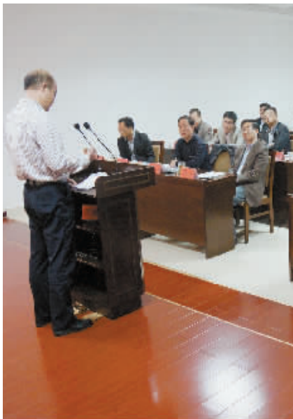
市城乡规划管理局规划业务研讨会及表彰场景。