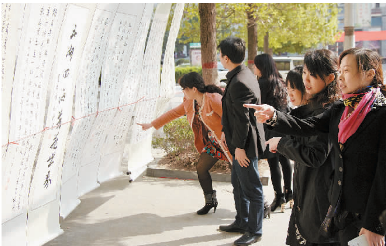
近日,平桥区平西办事处开展书画摄影一条街活动,推进了社区文化建设,丰富了社区居民文化生活。图为群众参观欣赏时的场景。海龙 摄