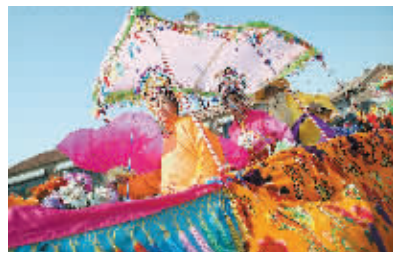
10月24日,在河北省廊坊市安次区后屯村,彩船会艺人表演“竹马早船”。后屯村彩船会有80余年历史,在该村老人手中保存着40多个完整的曲牌,至今已传承6代。目前,后屯彩船会正在申请河北省非物质文化遗产。