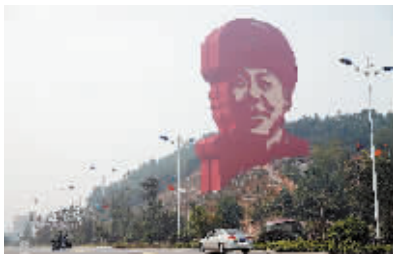
10月24日拍摄的雷锋头像雕塑。近日,一座修建在长沙街头的高约30米的雷锋头像雕塑主体工程完工。这座双面雕塑为钢筋混凝土材质,处于长沙市雷锋大道进入望城区的位置,这也将成为进入雷锋故乡望城的一座标志。

目前,我国废旧纺织品回收方式主要是依靠小商贩回收、小区定点集中等。而发达国家的一些服装企业,已经开始通过无偿或提供优惠券等方式,鼓励顾客将不需要的服装送回店里进行二次利用。与之相比,我国有很大差距,也造成了浪费。孙淮滨说,针对废旧纺织品的回收再利用,中纺联将推动制定合理经济的废旧纺织品循环利用技术路线,健全废旧纺织品定点回收和处理加工网络,建立并完善清洁生产标准体系和质量标准、检测、监督体系,扩大废旧纺织品再利用产品的市场应用,最终推动废旧纺织品综合利用产业规范化、规模化发展。