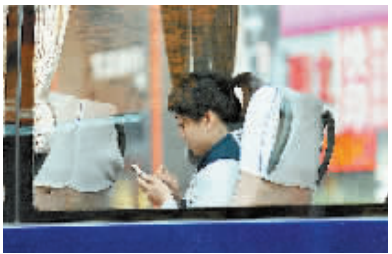
10月24日,一位女士在公交车上使用手机。公交站、餐厅里、马路边甚至是开着车,总有不少人双眼盯着手机屏幕,刷微博、看新闻、玩游戏……伴随智能手机功能的日益强大,玩手机的“低头族”队伍也越来越壮大。