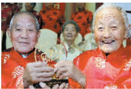
浪漫金婚 幸福久久

10月10日,一对老人手持金婚纪念品留影。当日,2013年百名老人金婚庆典活动在上海松江雪浪湖度假村举行。庆典仪式上,50对身着亮丽唐装的金婚夫妇相依相偎的走上“红毯”,演绎五十年相知相爱、相扶相携、患难与共的爱之历程。