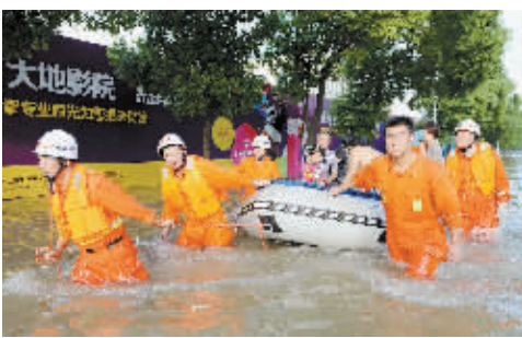
大水“围城” 四方支援

10月10日,来余姚支援的杭州消防支队武警官兵在余姚市南西路帮助转移被困群众。受台风“菲特”影响,浙江省余姚市遭遇极端强降水,城区大面积被淹,城市交通基本瘫痪,部分区域停电停水,被大水“围困”数日。连日来,各方救援力量陆续抵达余姚,与当地政府一起积极开展抢险救灾工作。