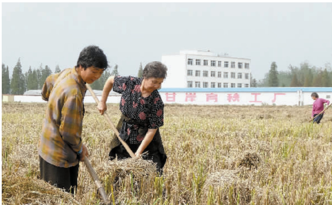
近期,平桥区甘岸办事处二郎村委会指导群众做好水稻收割前和收割后的紫云英适时播种工作,促使全村积极行动,迅速掀起了紫云英播种高潮。图为群众正在对紫云英种植土地进行翻耕。

目前,该工程已完成摸底调查及宣传发动工作,两户试点住户已选定,游客服务中心已选址,下一步待试点户改造规划定型后即可进场施工。