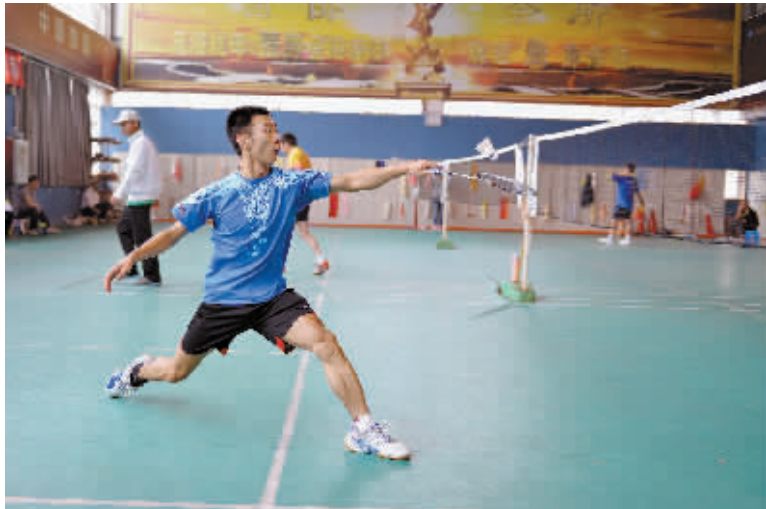
羽毛球运动在我市有广泛的群众基础,市四运会羽毛球比赛自然吸引了众多爱好者的参与。此次羽毛球比赛分青少年组和成人组,共设团体、男女单打、男女双打五个单项。图为比赛中运动员在网前搓球。本报记者 郝光 摄

本报讯(记者 杨柳)9月24日,固始县地税局李永海收到第二届“时代颂歌”全国诗人大赛组委会发来的喜报,其散文作品《梦里梦外》荣获一等奖,并收入《全国诗坛精品大观》。据了解,此次大赛由中国萧军研究会、北京市写作学会等联合主办。李永海现为中国作家协会会员。