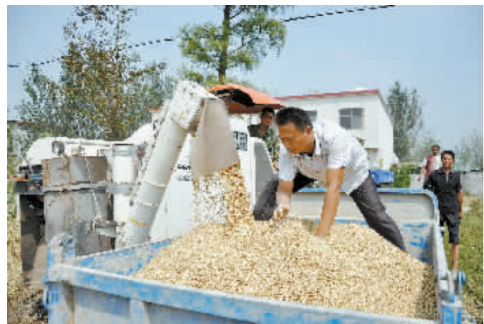
9月22日,记者在平桥区甘岸办事处二郎村几处优质粮基地看到,联合收割机纳粮吐谷,好一派秋收繁忙景象。

从古到今,翻阅历史,在信阳这样的例子不胜枚举。信阳籍明代文坛巨匠何景明,不尚奢华、不置产业,俸禄常常接济亲友;明朝永乐年间“蔬菜知县”胡寿安为官20余年,始终穿布衣、吃粗饭、睡纸帐;罗山籍嘉庆年间总督清廉大臣黎世序,倾毕生心血治河治水,造福百姓,却两袖清风;潢川籍为民请命的汪若霖,为官耿直的马祖常;光山籍力革吏弊的胡孟清,位卑德馨的陈朝侍等这些清官廉吏,“敢于直言”、“勇于担当”、“一心为民”、“乐善好施”的精神,(下转第二版)