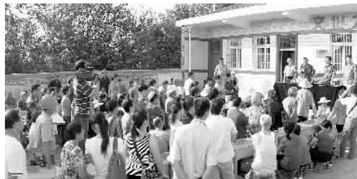
我市城市人口临战疏散、集结、接收、安置、动员场景。

本报讯(韩永立 刘倩倩)9月18日,羊山新区前进党工委、办事处认真贯彻落实市、区两级工作会议精神,安排部署节日期间重点工作,全面营造辖区风清气正的社会氛围。