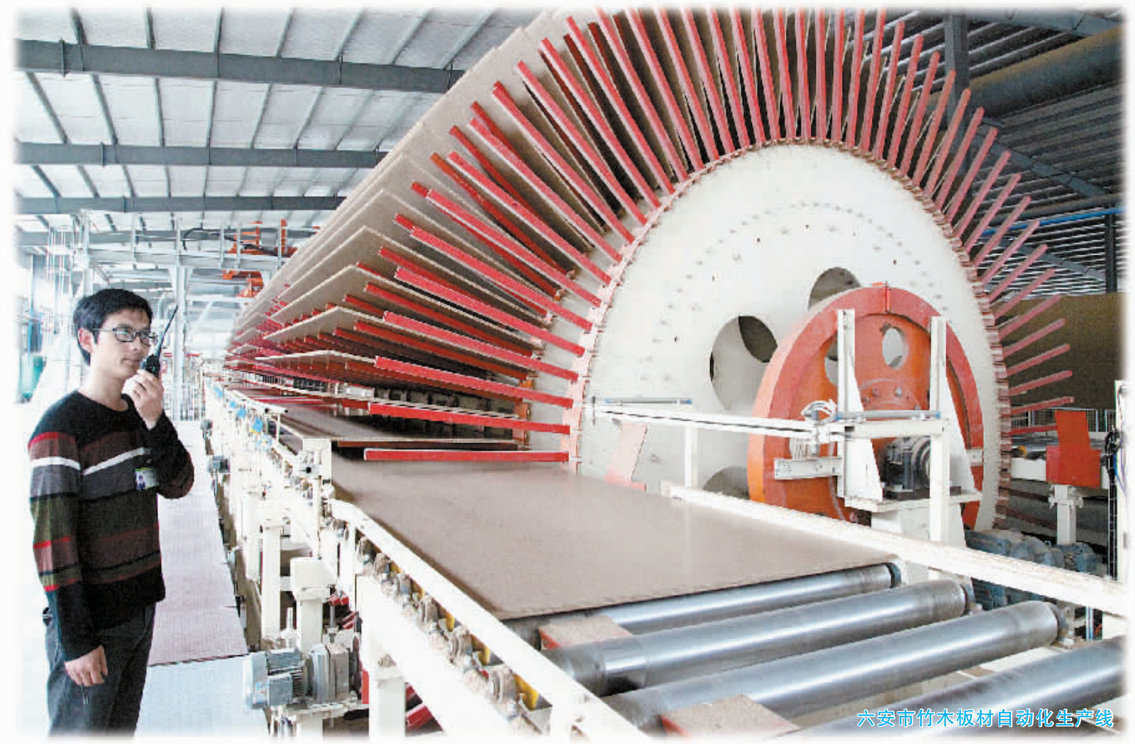
六安市竹木板材自动化生产线

过去,六安市工业经济整体特点是门类众多,企业规模偏小,产品附加值不高。近年来,该市开始从过去重微观的企业管理向重宏观的产业管理转变,充分发挥地方政府推进产业集群发展的作用,培育优势产业推进集群,