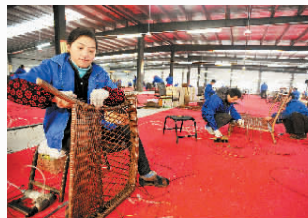
六安市柳编产品畅销国外