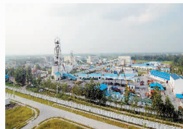
六安市绿色矿业一角