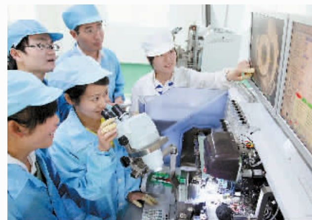
六安市现代化企业车间

特别值得一提的是,该市近期颁发的《六安市重点产业规划》,对六安市产业导向进行了明晰:2010年,通过大力发展汽车、钢铁、机电、农副产品深加工、建材、电力、纺织服装和特色高新技术等八大产业,着力延伸产业链,抓好大企业、大集团培育,初步构建起现代工业体系的基本框架和雏形,形成跨越发展的坚实基础和强大支撑;到2015年,通过组织实施一批重大产业化项目,全力打造产业集群,提高企业自主创新能力,形成相对完整的工业体系,全市人均工业增加值达到或接近皖江城市群的平均水平;到2020年,实现合肥经济圈制造业集聚区和鄂豫皖三省毗邻地区工业高地的目标。