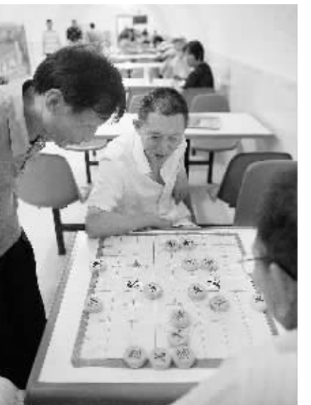
8月12日,成都市民在免费开放的人民公园人防工事纳凉点下棋。当日,成都最高气温达33摄氏度,位于成都市区人民公园内的老假山人防地下工事免费向市民开放。