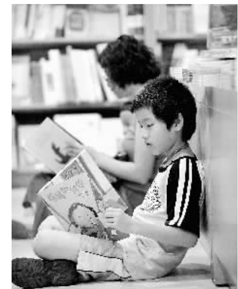
8月12日,一名小读者在台北诚品书店里阅读。在诚品书店有限的空间里,书籍、画廊、咖啡馆等元素共同代表“场所精神”,营造了一个呼应多种文化产业与终身学习主张的艺术生活空间。