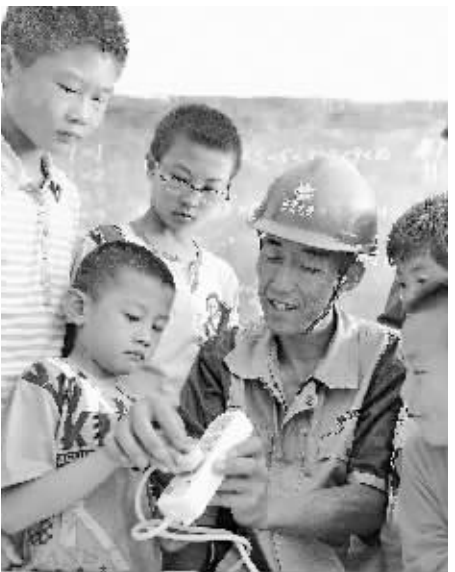
8月11日,河北省崇礼县供电公司针对暑期留守儿童多的情况,要求职工在深入到辖区农村工作时,为村里的留守儿童讲解安全用电常识。