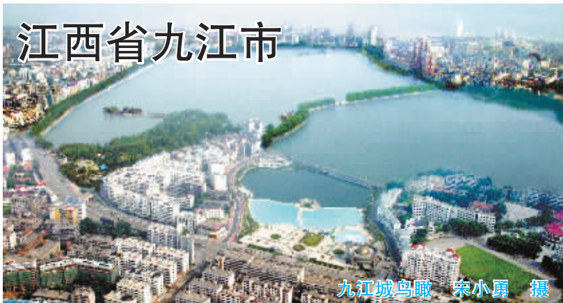
九江城鸟瞰

九江之称,最早见于《尚书·禹贡》中“九江孔殷”、“过九江至东陵”等记载。九江称谓的来历有两种,一是“九”为古代人们认为的最大数字,“九江”的意思是“众水汇集的地方”,“九”是虚指;二是“以为湖汉九水(即赣江水、鄱水、余水、修水、浚水、盱水、蜀水、南水、彭水)入彭蠡泽也”,即九条江河汇集的地方,“九”是实指。长江流经九江水域境内,与鄱阳湖和赣、鄂、皖三省毗连的河流汇集,百川归海,水势浩淼,江面壮阔。