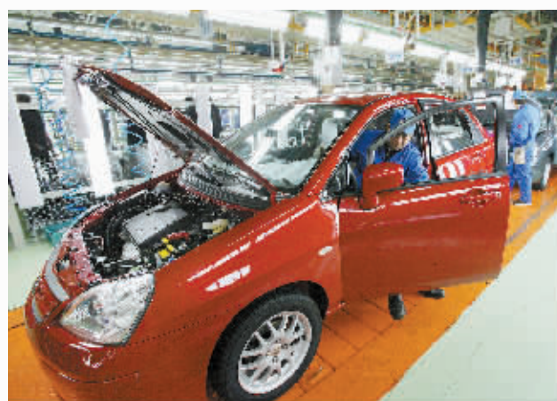
昌河铃木汽车有限公司生产线