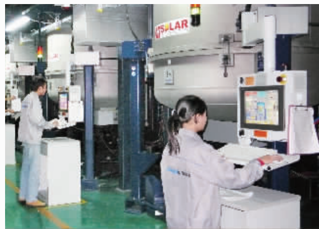
光伏产业旭阳雷迪公司生产线