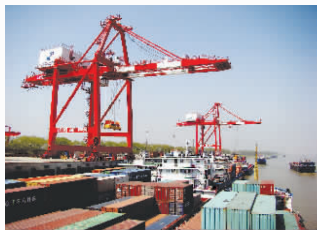
上港九江集装箱码头

工业强则经济强,工业兴则百姓富。以新型工业化为核心是九江必须坚持的发展路径。做强做大工业,才能把九江工业发展不断推向前进。只有这样,强市富民的脚步才能更为铿锵激越、振奋人心。