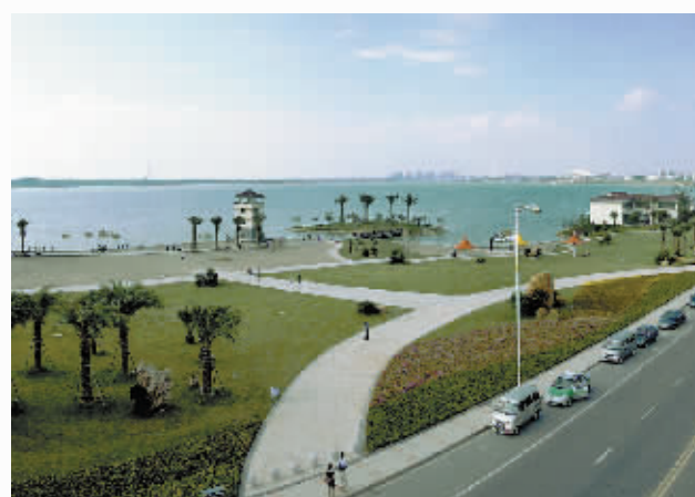
九江市八里湖新区沙滩浴场

眼下,信阳工业经济发展态势良好,我们更须乘势赶超;形势严峻,我们更当克难奋进。我们一定要坚定信心,攻坚克难,努力取得抓工业、上项目、攻集聚的更大成效,为提升魅力信阳建设水平积蓄能量、夯实基础。