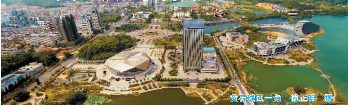
黄石城区一角

黄石市位于湖北省东南部,江南长江中游沿岸,武汉城市圈副中心城市,是我国中部地区重要的原材料工业基地和国务院批准的沿江开放城市之一。先后获得“水环境治理优秀范例城市”、“国家园林城市”、全国首个“电子政务试点城市”、“国家级创业型城市”、“全国科技进步示范市”、“国家新型工业化示范基地”、“国家节水型城市”、“2010中国十大经济转型示范城市”、“全国集邮文化先进城市”、“创建国家公共文化服务示范区城市”、“全国创业先进城市”、“中国观赏石之城”、“中国男装名城”、“省级历史文化名城”、“中国挤出模具之都”、“国家外贸转型升级黄石服装示范基地”称号和“全国水环境治理人居环境项目范例奖”。毛泽东主席曾两次亲临黄石视察工作。