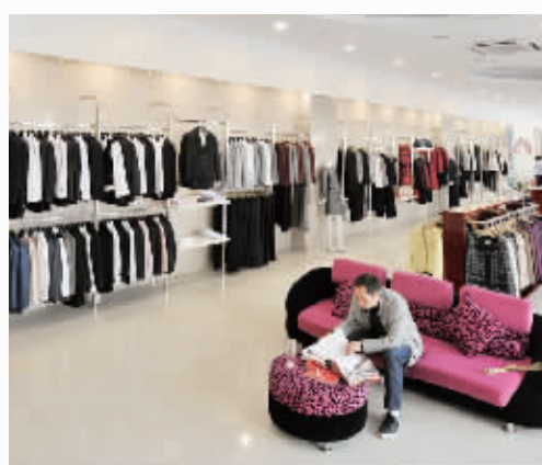
美尔雅服装展示厅