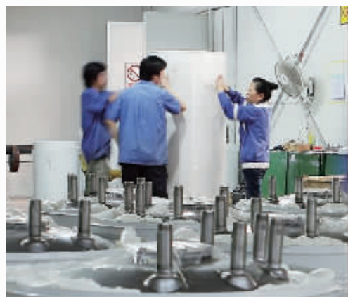
东贝热水器生产车间