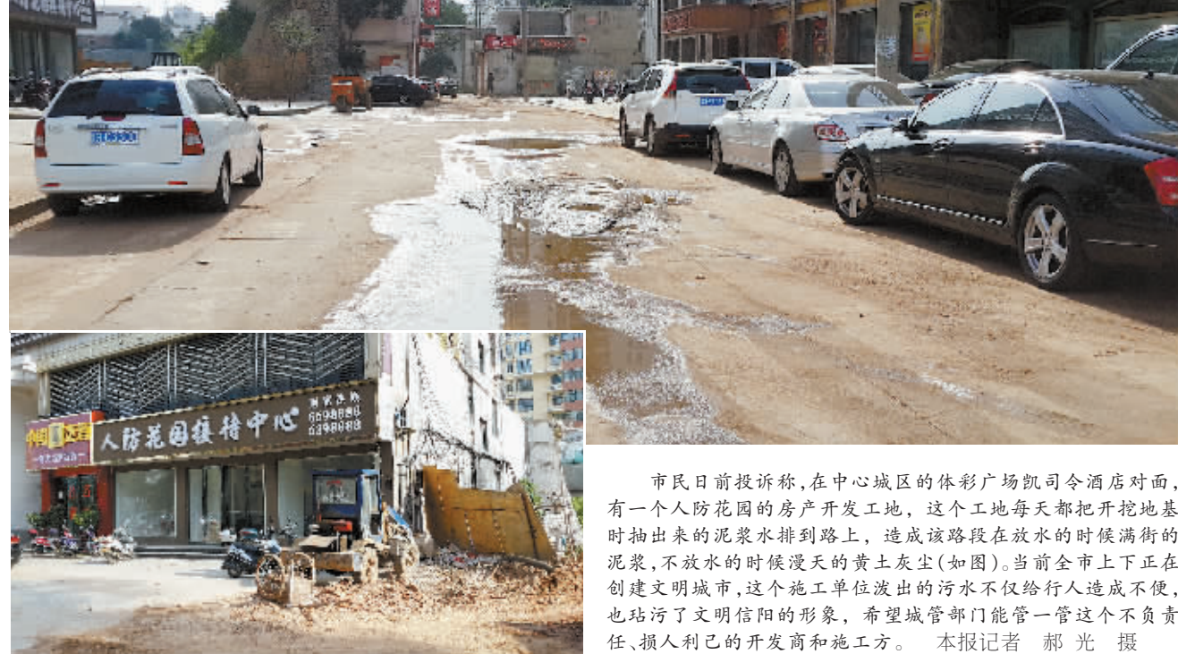
市民日前投诉称,在中心城区的体彩广场凯司令酒店对面,有一个人防花园的房产开发工地,这个工地每天都把开挖地基时抽出来的泥浆水排到路上,造成该路段在放水的时候满街的泥浆,不放水的时候漫天的黄土灰尘(如图)。当前全市上下正在创建文明城市,这个施工单位流出的污水不仅给行人造成不便,也玷污了文明信阳的形象,希望城管部门能管一管这个不负责任、损人利己的开发商和施工方。