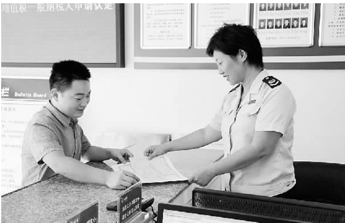
税务人员向纳税人发放税务登记证件

本报讯(记者 赵锐 文图)“营业税改征增值税降低了税负,为我们企业带来了实实在在的优惠。”8月1日上午,漯河国税局辖区业户奥斯卡影城一位财务人员在顺利开出第一张增值税发票