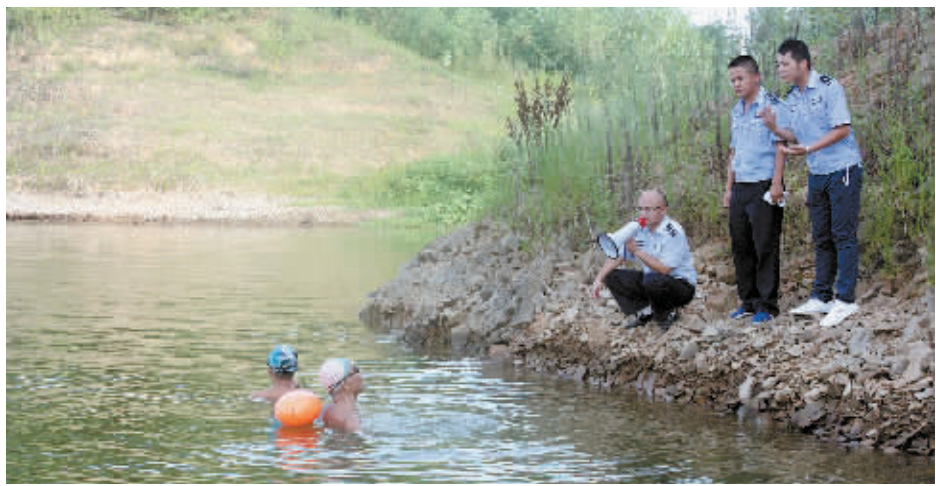
图为执法人员规劝游泳者上岸。