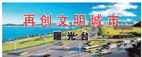
再创文明城市 曝光台

远就看见水面上已有不少人在游泳,执法队员们上前大声喊话,规劝游泳者们上岸离开。水里还有不少大人带着孩子在游泳,当记者问上岸的家长,带孩子在水库游泳不担心安全吗?这位家长很不屑地说:“有我在,怕什么。”