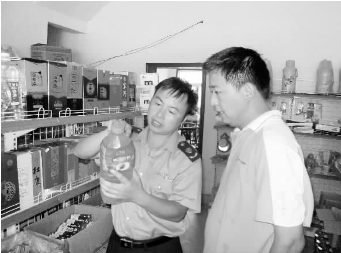
近日,新县新集工商所在夜晚开展了对辖区网吧、洗脚城、KTV等行业的专项巡查,共检查网吧11家、洗脚城5家、KTV10家。对3家洗脚城、2家KTV没有办理营业执照营业经营行为,当场下达了责令改正通知书,限期办理。对其中1家多次催办仍未办理营业执照的KTV商户进行立案查处。

助9000元。省民政厅、省财政厅《豫民文[2013]118号》规定,从2011年起,退役后,每年每人享受自主就业金4500元。(五)义务兵家庭优待金。以我市2012年优待金发放标准为例,城镇户口每年最高11400元,最低9840元;农村户口每年最高7650元,最低4650元。上述几项累计,服役义务兵两年,本人或家庭直接享受的经济待遇,应届本科毕业生约7.7万元,专科毕业生约7.1万元;高中城镇户口最高约5.6万元,最低约5.2万元;高中农村户口最高约4.8万元,最低约4.2万元。另自入伍起,衣、食、住、行、医、险军队全包,不需本人出钱。”