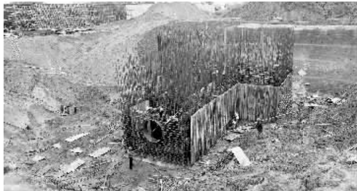
污水处理二期工程是我市中心城市重点基础设施项目,也是我市重要的民生工程。目前,工程施工人员正紧张有序地施工。图为市污水处理二期工程建设现场。