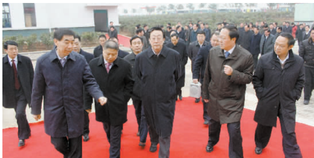
河南省委书记郭庚茂(前中)、河南省副省长王铁(左一)等领导视察新区

作为把我市建成鄂豫皖三省交界区域性中心城市的重要主体,羊山新区深知,推进“人的城市化”是推进城市化的核心,做大产业是做大城市的根本。在今年召开的年度工作会上,羊山新区吹响了“实施二次创业、建设六大园区”的集结号,要弘扬创业的精神和激情,把城市与兴产业更加紧密地结合起来,在扩大城市规模的同时提升新区实力,努力走好产城良性互动发展的路子。一是建设国际家居小镇,打造中原经济区家居产业示范基地;二是建设市级商务中心区,打造信阳综合服务中心;三是建设特色商业区,打造信阳现代商贸物流枢纽;四是建设茶产业集聚区,打造休闲茶都名片;五是建设职业教育园区,打造信阳智力人才高地;六是建设北湖文化科技园区,打造山水信阳经典。六大园区规划建设,坚持功能集合构建,企业集中布局,空间要素集约利用,工业、商业、物流业、旅游业和现代服务业集群发展,将为新区长期快速可持续发展提供强劲支撑。六大园区,以人为本,以全面协调可持续发展为贵,既着眼素质的提升,又考虑现实的生活,更追求长远的发展。我们有理由相信,在不久的将来,一个宜居宜业、宜创宜游、经济发达、文化繁荣的区域性中心城市一定会屹立在鄂豫皖三省交界之地,一个富于朝气、充满人气、纵横财气、洋溢福气的新型城镇化建设的典范一定会矗立在中原经济区建设的最前沿。