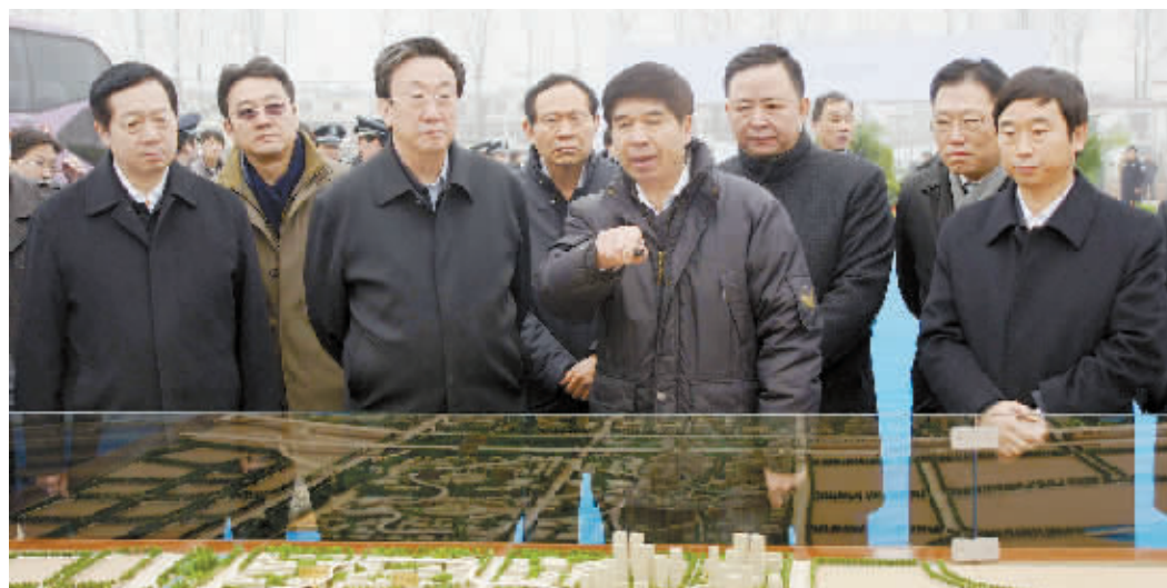
信阳市委书记郭瑞民(左一)、市长乔新江(右一)陪同河南省委书记郭庚茂(左三)视察新区