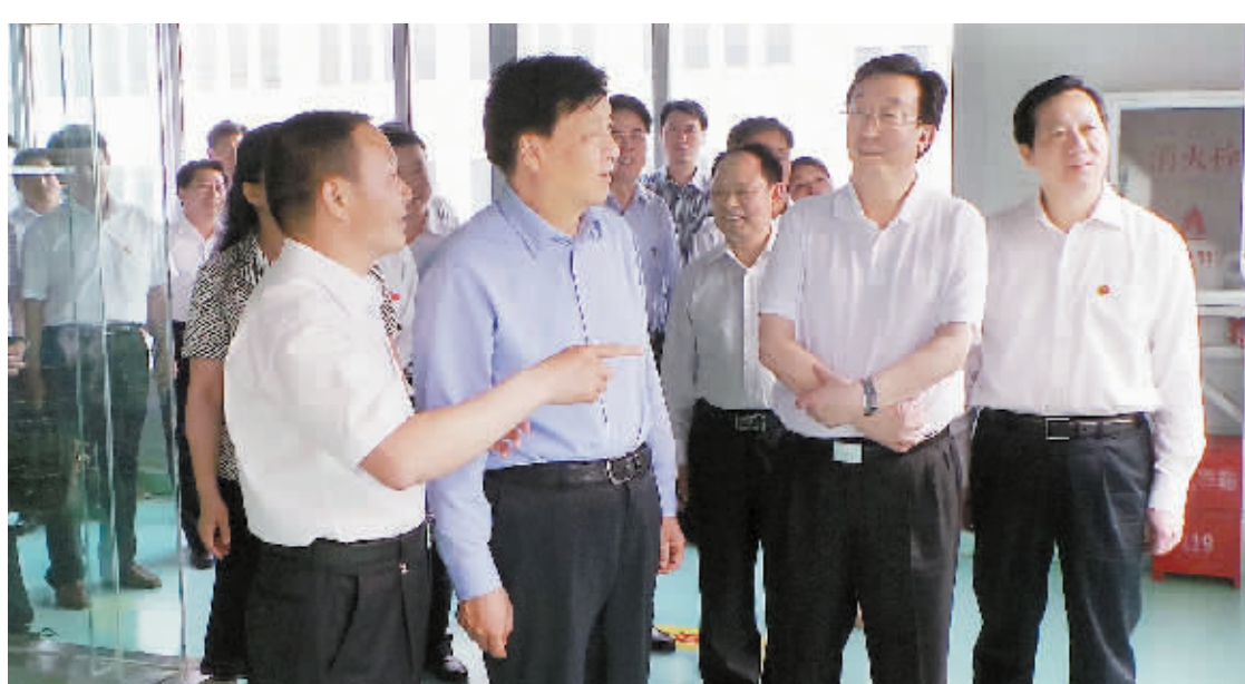
5月17日下午至20日上午,中共中央政治局常委刘云山到河南安阳、信阳,深入太行山、大别山腹地,瞻仰革命遗址,重温光荣传统,看望老党员老红军,走访基层干部群众,听取对党建工作的意见建议。图为刘云山(前排左二)在河南省委书记郭庚茂、信阳市委书记郭瑞民等陪同下视察羊山新区文新茶叶新科技园。

2013年6月19日 中共信阳市委主管主办 信阳日报社出版 国内统一刊号:CN41-0015 信阳新闻网:http://www.xyxxw.com.cn 星期三 癸巳年五月十二 邮发代号:35-32 第7978期 今日特刊4版