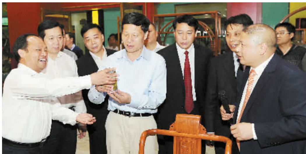
河南省委副书记、省长谢伏瞻(前中)视察羊山新区