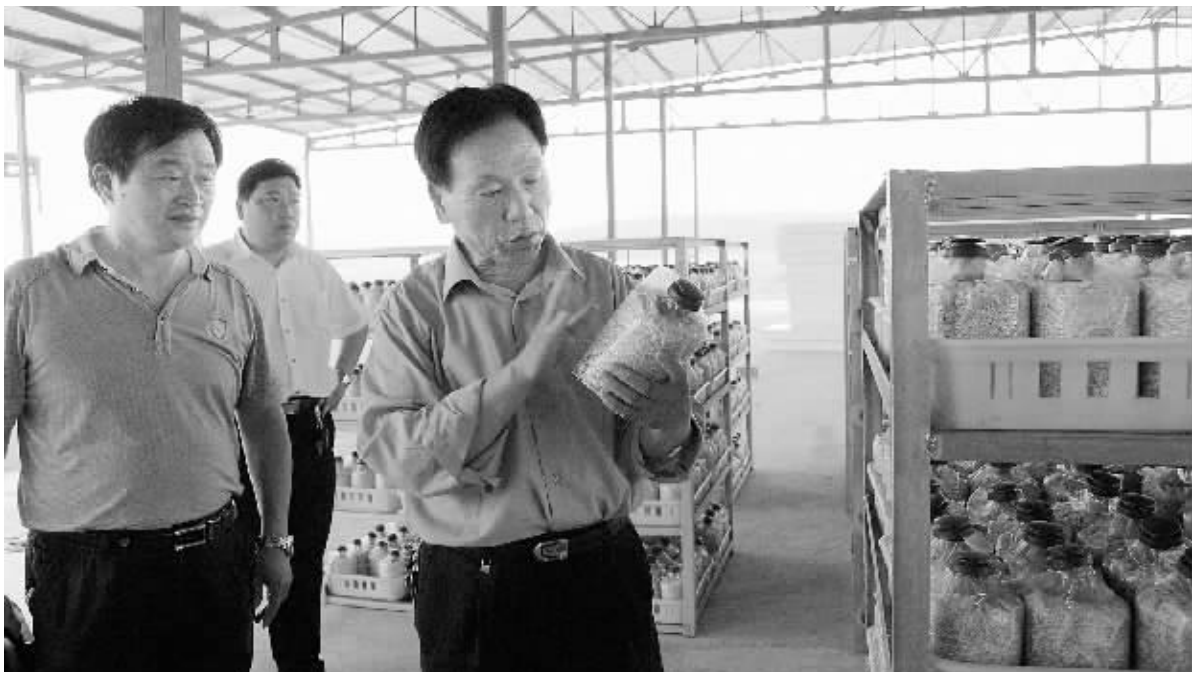
今年以来,在潢川农信社的大力扶持下,潢川九龙春天农业科技有限公司成立了食用菌专业合作社,采取提供菌种、回收食用菌鲜品与废菌包的模式,探索出一条社员、合作社、农信社“三社”共赢之路。该公司目前已实现营业收入3620万元。