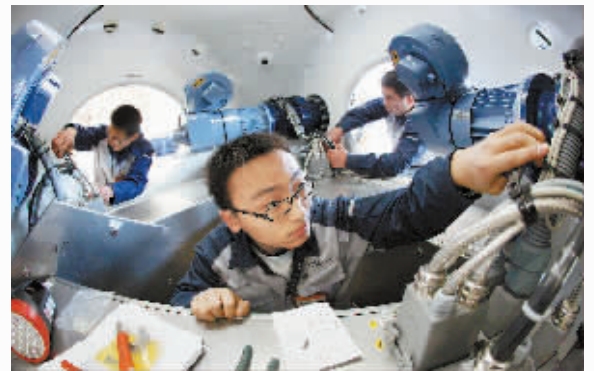
国电联合动力技术(保定)有限公司员工组装风电整机。

目前,对接首都经济圈规划的“保定行动”已经启动。发展应借力,借力应“环视”。保定需要在“环视”中定位,在精准定位中发展。(孙鹏)