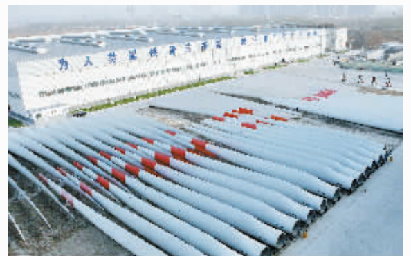
图为中航惠腾风电设备股份有限公司生产的风机叶片。翟志刚 摄