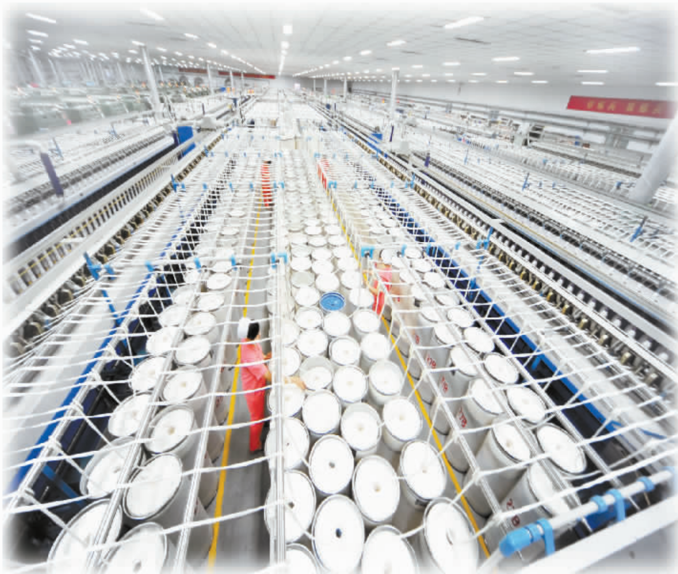
图为河北宏润新型面料有限公司万锭纺纱车间。

推进产业链向高端延伸,着力培育高新技术产业,集中资源突破一批关键核心技术,形成一批具有重大引领作用的创新成果和自主知识产权。实现培育新产业、研发新产品的新突破。高碑店节能门窗、涿州市金属和非金属材料、安国市中药制剂等高端产业,长城轿车、风帆工业电池、乐凯薄膜和光学材料、宏润绒衫等高端产品,从无到有、从弱到强。近几年,全市每年取得包括国家973计划和863计划在内的新科技成果超过100项。英利“熊猫”单晶硅电池生产线平均转换效率率达到19.5%,实验室最高转换效率达到21%,成为世界三大高效太阳能电池之一。按太阳能电池转换效率每提高一个百分点,太阳能电池组件发电成本可降低7%计算,“熊猫”电池0.5个百分点的提升,每年为企业增收近1亿元。