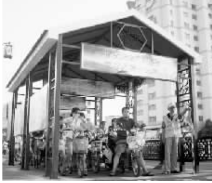
街头遮阳篷。