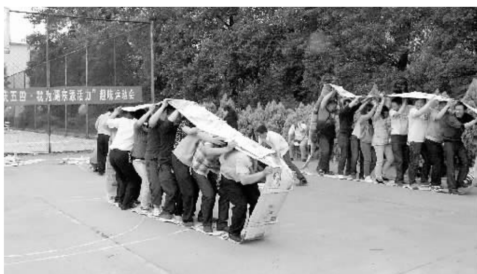
5月2日,浉河区湖东办事处团工委举行了别开生面的趣味运动会,通过蒙眼敲锣、螃蟹赛跑、无敌风火轮等竞赛主题,进一步激发团员青年们的激情和活力,弘扬了五四精神,加深了全体青年干部对“团结拼搏、乐于奉献、善于创新、勇争一流”湖东精神的感悟。

相连的,如南湖路红星4组(户号61660),采取挪移、重砌等措施;对原有大钢板井盖,如成功花园、浉河宾馆等,再焊割小孔便于抄表,同时加固加装铁链用于防盗;对找不到表的,如红星4组师院东门(户号64134)、平桥区十八里(户号110367)等,通过采取多名抄表员回忆,多次与了解情况的用户沟通,在分析出的大致方位,破路开挖寻找等手段,最终找到水表并挪动位置重新砌筑恢复表井。三是整改完成一处,验收一处,周一汇总,监察部审核工程量,企管部逐个再核实验收。