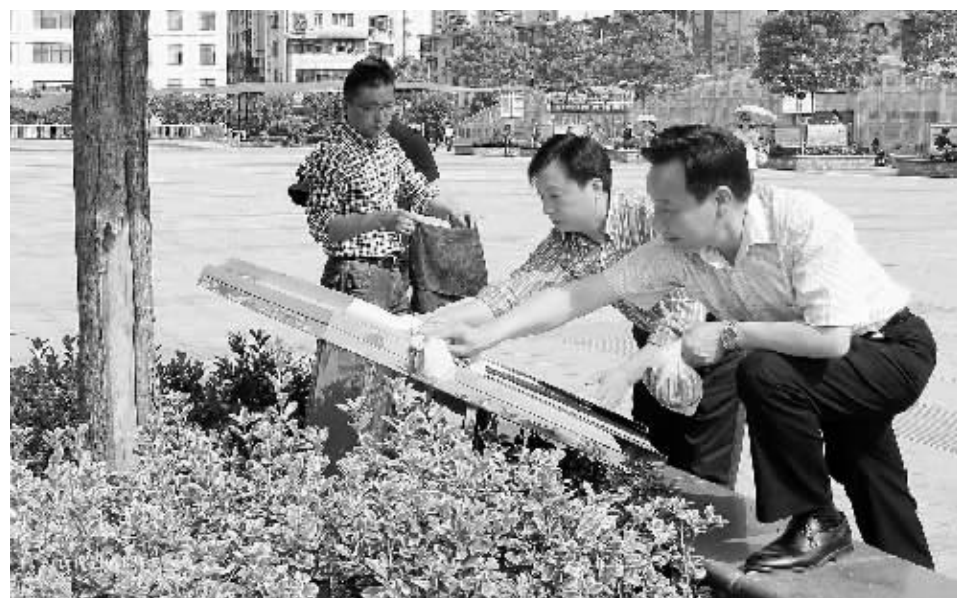
5月3日,浉河区五里墩街道党工委、办事处开展“崇尚清廉,爱我家园”教育活动,组织80名机关、社区工作人员自带工具,全面清洗廉政文化广场的围栏、旗幔、牌匾、花坛等,随后大家逐一参观学习50多块廉政文化牌匾,使全体工作人员对廉政文化有了更深认识,达到廉政再教育的目的。