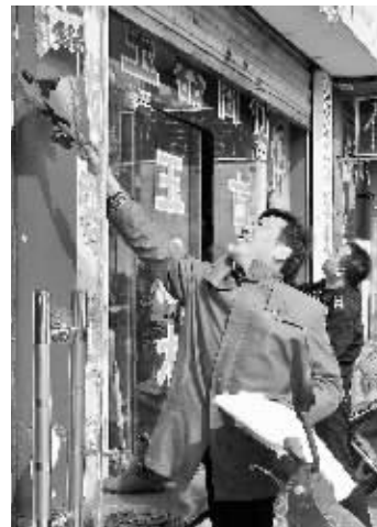
整治火车站窗口区域