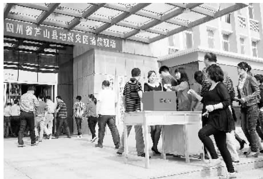
5月3日,羊山新区前进办事处举行“情系灾区献爱心”捐款活动,200多名机关人员及各居委会干部踊跃捐款。