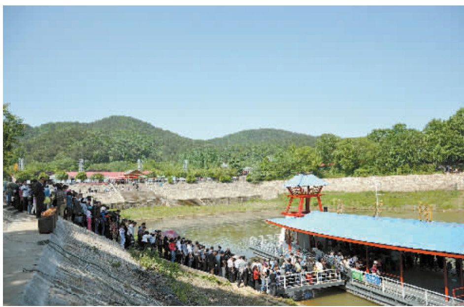
5月1日,南湾湖众游人正在等待登船。

池、许世友将军故里等景区累计超过2000辆。 山水休闲备受青睐,温泉度假热度不减。“五一”小长假,到信阳休闲度假最令人心目,不少游客慕名而来,仅鸡公山单日最大接待量就达到3.2万人次,同比增长40%;南湾湖单日最大接待量1.3万人次,一度达到饱和,由于游船运力严重不足,部分时段实行了限流。灵山、西九华山、新县红色系列景区等单日最大接待量也都超过1万人次。净居寺、汤泉池景区3天接待游客1万人次以上。 节赛助推市场,活动集聚人气。茶文化节前,第五届“信阳毛尖·龙潭杯”全国自行车公开赛,吸引了来自全国19个省、市、自治区以及港、澳、台地区800多名单车爱好者;信阳第二十二届国际茶文化节暨2013中国(信阳)国际茶业博览会、国际茶城运营启动、“赏春花·品春茶”系列旅游推介活动、《信阳茶文化》系列邮票暨主亚那(鸡公山)邮票首发式等多项茶文化节活动,都为假日旅游市场攒足了人气,不仅活跃了市场,而且也带动团队数量的递增。 准备工作充分,前期宣传有力。市委、市政府高度重视假日旅游工作,茶文化节前,市领导亲自参加各项茶文化节及旅游活动并深入景区、车站、码头等游客集散地检查指导假日旅游工作;市假日办及时启动假日旅游运行