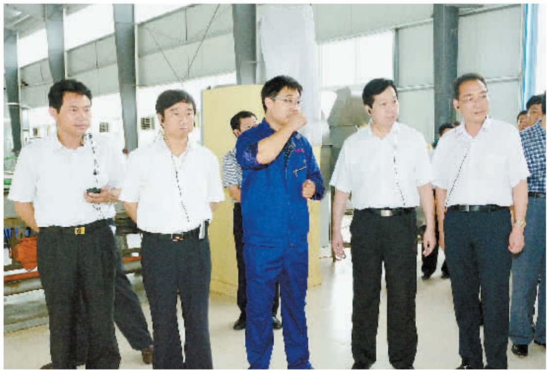
市委书记郭瑞民、市长乔新江在商城县委书记李高岭、县长周哲的陪同下检查指导产业集聚区工作

商城，一处生态宜居的土地，一方开放创业的热土。近年来，该县深入贯彻落实科学发展观，紧紧围绕建设“美丽乡村、幸福商城”的宏伟目标，统筹推进新型城镇化、新型工业化、新型农业现代化“三化”协调发展，持续培育产业集聚区、茶产业和旅游经济“三大支撑”，激活财源建设、招商引资、项目建设“三大引擎”，强化民生改善、和谐构建、环境营造“三大保障”，经济社会发展步入快车道。