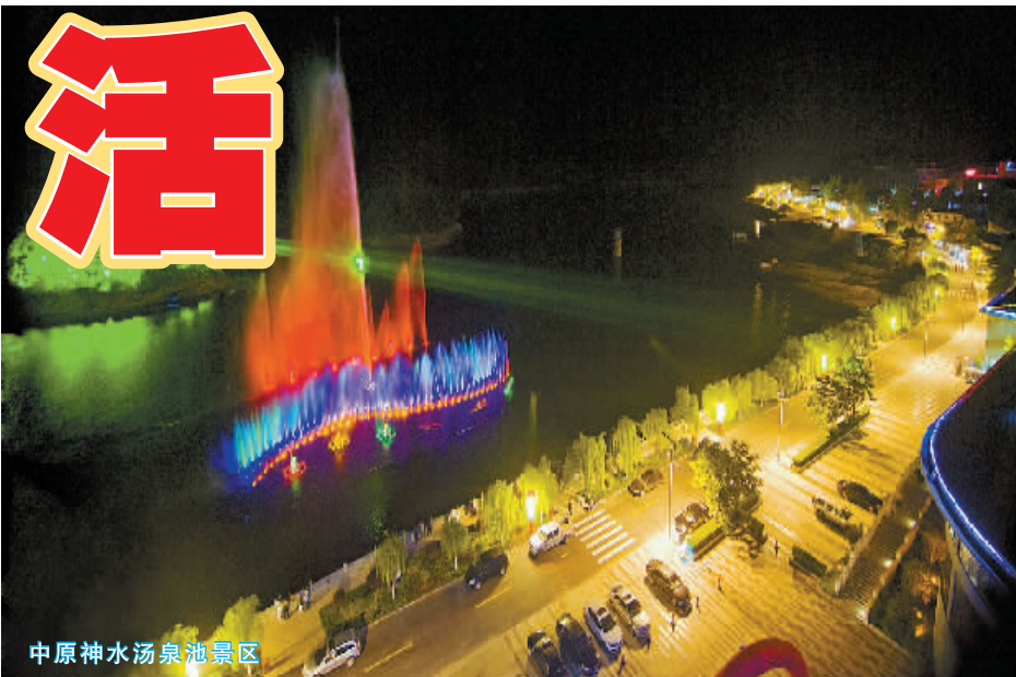
中原神水汤泉池景区

项目建设内容：依据现有地形、水塘和小山进行创意设计，改造休闲广场、停车场，集购物、美食、娱乐、休闲、风情民宿、拆迁安置、新农村社区建设为一体，建成仿古一条街。 项目投资及资金来源：5000万元，招商引资。 合作方式：甲方提供土地80—120亩，实行统一规划、统一设计、统一风格、统一建设，除了安置拆迁户41户，尚余土地用于商业开发，建成集旅游购物、特色美食、休闲娱乐、民情民俗、农家生活体验为一体的综合街市，双方合作开发，从开发盈利中偿还乙方建设投入，项目建设周期为2年，可收回资金亿元，实现盈利5000万元。 联系人：江先生 0376-7444002 13839751321