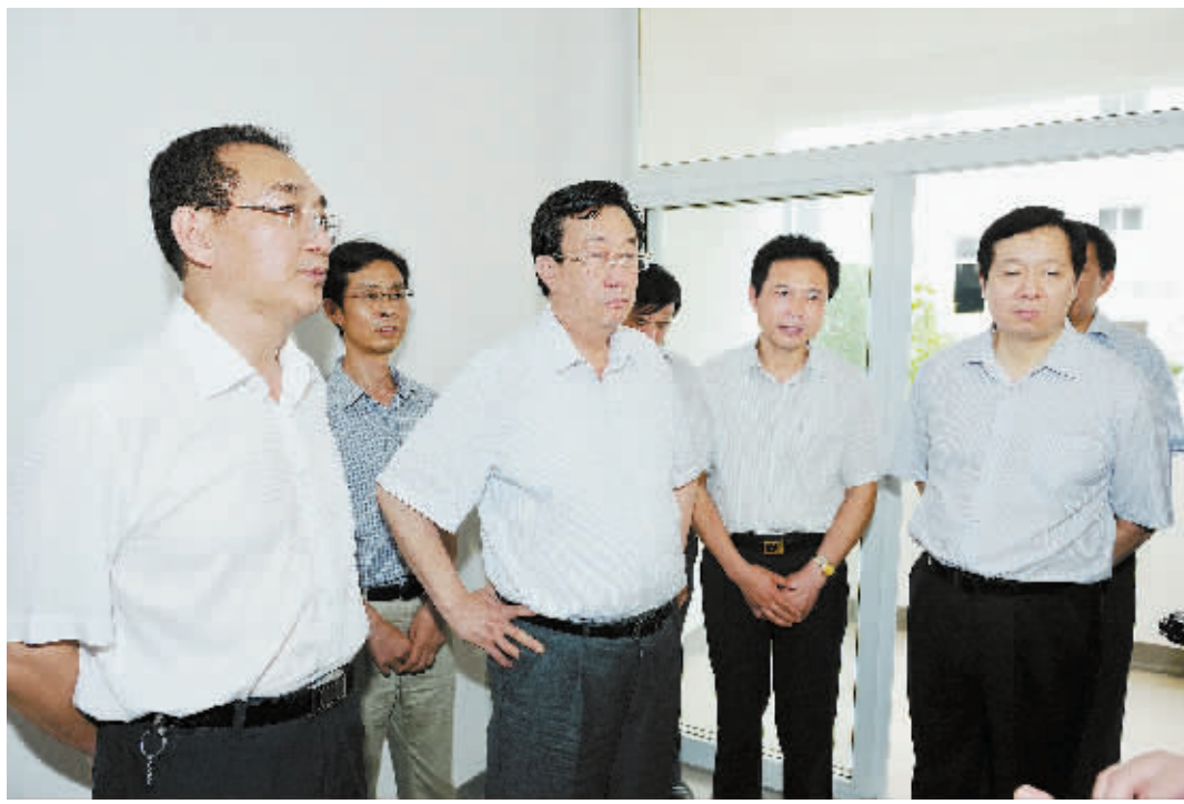
省委书记郭庚茂在商城县委书记李高岭、县长周哲的陪同下参观商城县保障性住房建设