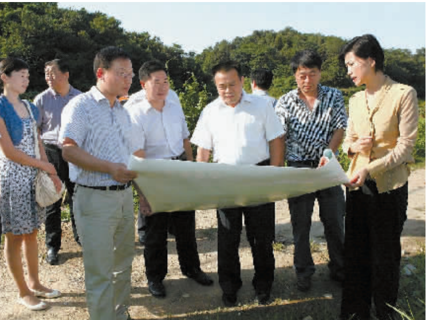
浙河区委书记邵春杰到五星办事处琵琶山社区指导项目建设