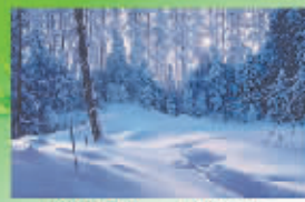
洛格深伊 山林晨光