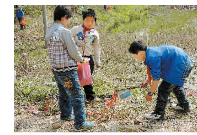
近期,商城县开展了“美丽乡村幸福商城”建设活动,集中整治环境卫生。图为该县汪桥镇首幼小学的学生们响应该县提出的“小手拉大手,建设美丽乡村幸福商城”的号召,利用劳动课时间清除路边的垃圾。

本报讯(张益铭)截至2013年3月底,浉河区城乡居民养老保险参保人员信息数据已全部导入省养老保险局城乡居民养老保险信息管理系统,参保人员信息数据实现上线运行,为下一步城乡居民参保工作向基层延伸打下了坚实基础。 浉河区从2012年7月正式实施城乡居民养老保险,截至今年3月底,该区城乡居民参保人数19.2万人,其中待遇享受人数4.7万人,参保缴费人数14.4万人。为了给参保群众提供零距离服务,让参保群众在家门口直接办理参保缴费业务,浉河区人社局开通了城乡居民养老保险参保信息管理系统,目前城区居民可直接在乡镇、办事处办理城乡居民参保登记、缴费等业务。 责编:韦海俊 广义 照排:孟缘