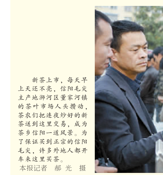
新茶上市,每天早上天还不亮,信阳毛尖主产地浉河区董家河镇的茶叶市场人头攒动,茶农们把连夜炒好的新茶送到这里交易,成为茶乡信阳一道风景。为了保证买到正宗的信阳毛尖,许多外地人都开车来这里买茶。

本报讯(蒋仑 黄成高)日前,新县矿产资源规划(2008-2015年)已被省国土资源厅批准实施,该县政府对矿产资源规划进行公布并正式执行。 在规划期2008-2015年内,按照成矿地质条件、矿产供需关系、国家产业政策、相关规划要求,以及资源环境承载能力,该县划分重点勘查区1处,禁止勘查区4处,限制勘查区1处,鼓励勘查区1处;设置勘查规划区块10处,其中中矿8处,铅多金属矿1处,银多金属矿1处;矿山数量在2010年的基础上减少10%以上,维持在25家左右;开展综合利用的矿山数量占综合利用矿山的比例达到80%以上,矿产资源综合利用率平均提高3%,尾矿利用率达到15%以上。 该规划的实施,在强化矿产管理的同时,妥善处理好当前与长远、局部与全局的关系,促进矿产资源开发与经济和环境协调发展。