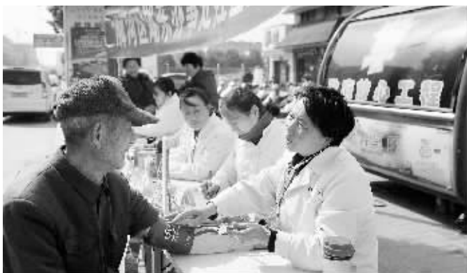
日前,浙河区湖办事处组织社区医务志愿者服务队举办便民义诊活动。志愿者们用真诚的服务态度、专业的医学知识,为群众把脉健康。图为活动现场。

疗行为,认真落实传染病早发现、早诊断、早报告、早隔离、早治疗的原则,积极对呼吸道传染病进行分诊、治疗。各相关科室明确责任,加强保障,密切关注传染病疫情变化趋势,对疑似病例进行认真筛查,对报告病例开展流行病学调查,并做好标本的采集与运送。同时,该院医护人员还开展了春季传染病防控知识培训,进一步提高呼吸道传染病性疾病应对能力。