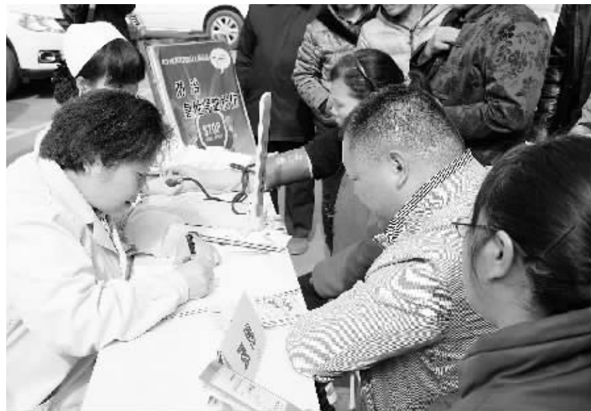
在3月14日第八个“世界肾脏日”,信阳市中心医院肾病专家在该院门诊楼前举办世界肾脏日健康专题义诊咨询活动。图为活动现场。