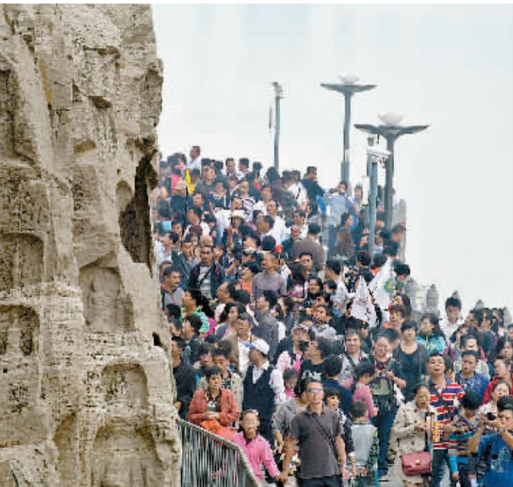
日前,游客在洛阳龙门石窟景区游览。

6日晚,温家宝在毕节听取了贵州省委省政府的工作汇报,对近年来贵州省经济社会发展取得的成绩给予充分肯定。他说,近年来,中央出台了一系列有利于贵州发展的政策措施。希望贵州牢牢抓住难得的历史机遇,着力解决贫困落后这一突出问题,逐步缩小与其他地区的差距,努力实现经济社会发展的历史性跨越,与全国同步全面建成小康社会。