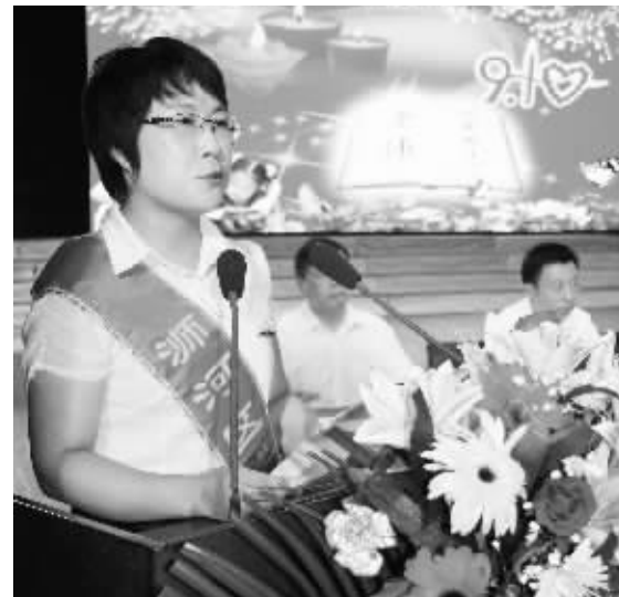
日前,浉河区庆祝第二十八个教师节表彰大会在文化中心隆重举行。大会对全区十大模范教师、优秀教师和优秀教育工作者进行了表彰。图为获表彰教师代表在发言中。

珠新型电阻膨胀炉成套设备”项目;列入国家重点新产品计划项目1项:信阳天意节能技术有限公司“相变储能无机保温板”项目;列入国家科技型中小企业技术创新基金项目2项:信阳市非金属材料研究所承担的“信阳市非金属材料公共技术服务平台”项目和信阳市浉河区技术开发交流中心承担的“信阳市机电公共技术服务平台”项目。上述6个项目成功列入国家科技计划,表明我市积极争取国家级项目取得了新成效。