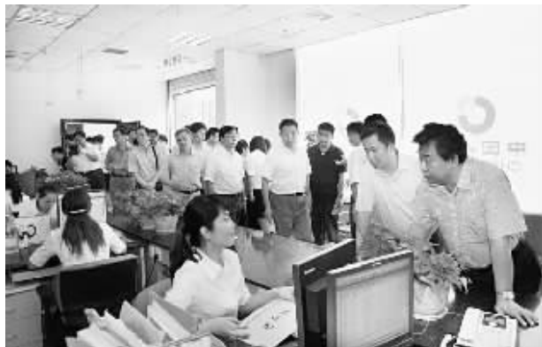
图为日前与会代表参观中国人寿河南省分公司新农合医疗管理服务大厅。