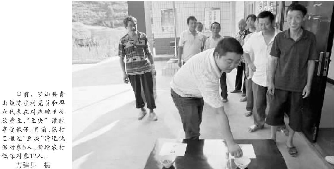
日前,罗山县青山镇陈庄村党员和群众代表在对应碗里投放黄豆,“豆决”谁能享受低保。目前,该村已通过“豆决”清退低保对象5人,新增农村低保对象12人。