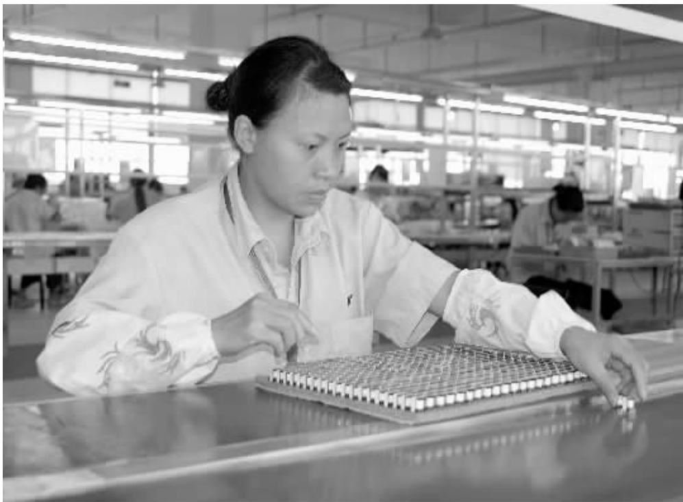
去年8月入驻罗山产业集聚区电子产业园的罗山大忠电子有限公司,是一家集研发、设计、生产、销售于一体的电子变压器专业制造商。