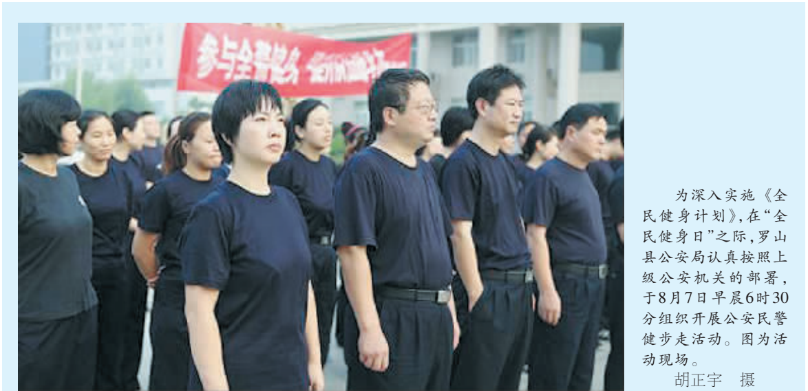
为深入实施《全民健身计划》,在“全民健身日”之际,罗山县公安局认真按照上级公安机关的部署,于8月7日早晨6时30分组织开展公安民警健步走活动。因为活动现场。

院从检察职能出发,结合当前工作的重点和热点研究出要抓的工作,做好“十件实事”工作,前提必须有正确的思想认识,不能有厌倦、懈怠情绪。二是要把工作做实。“十件实事”件件与民生相关,件件与检察职能紧密相连,工作中要多干点活、做点实事,不能只填一填表就了事,要帮助群众解决一些困难和实际问题。三是要统