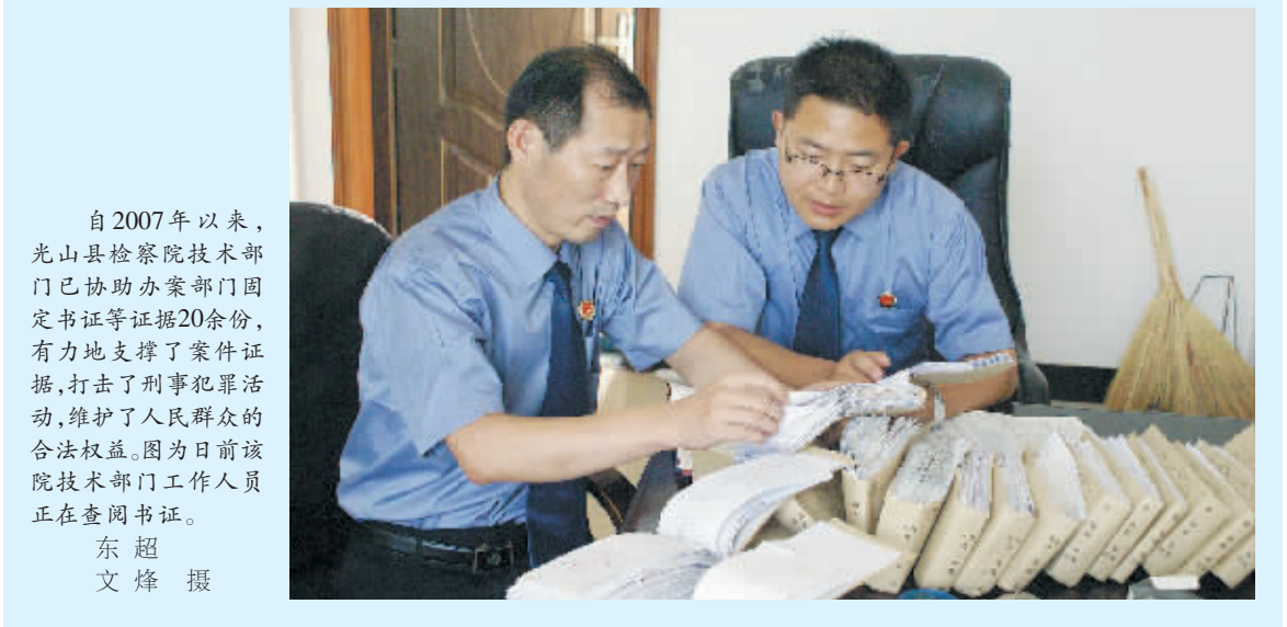
自2007年以来,光山县检察院技术部门已协助办案部门固定书证等证据20余份,有力地支撑了案件证据,打击了刑事犯罪活动,维护了人民群众的合法权益。图为日前该院技术部门工作人员正在查阅书证。