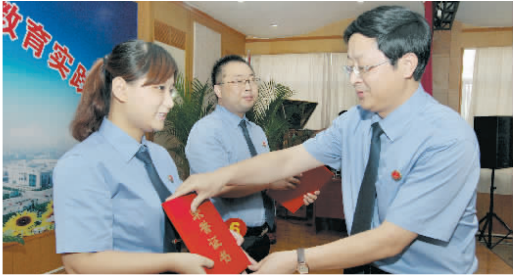
为推动政法干警核心价值观教育实践活动的深入开展,充分展示检察机关践行“忠诚、为民、公正、廉洁”政法干警核心价值观教育成果,日前,市检察院举办全市检察机关行政法干警核心价值观演讲比赛决赛。图为市检察院领导为获奖选手颁奖。