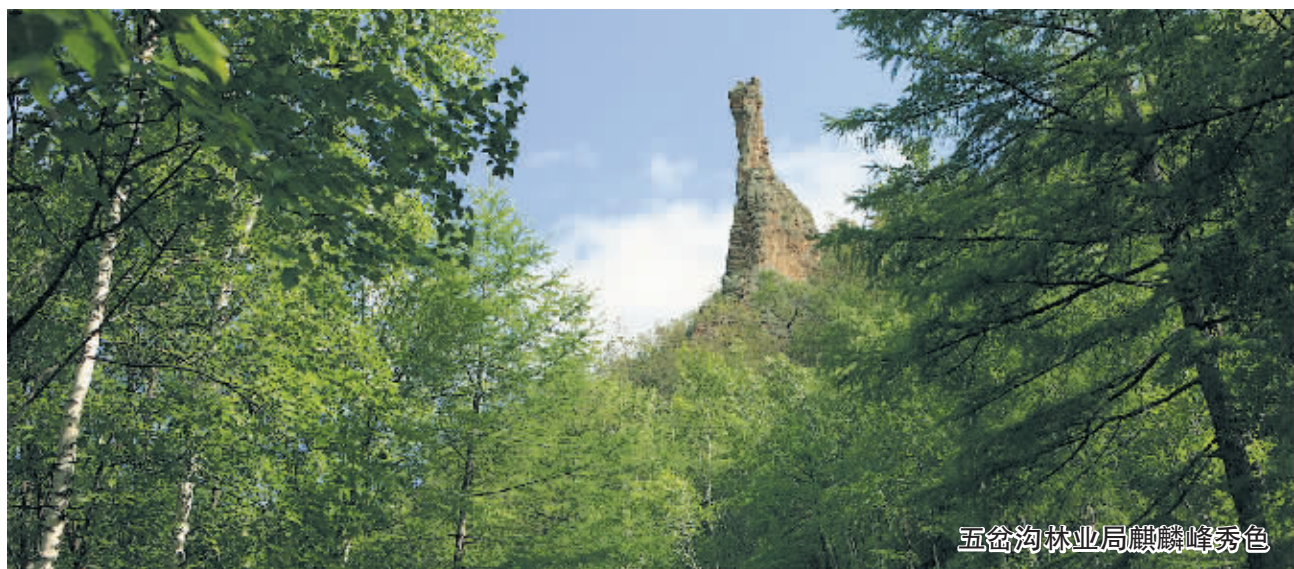
五岔沟林业局麒麟峰秀色