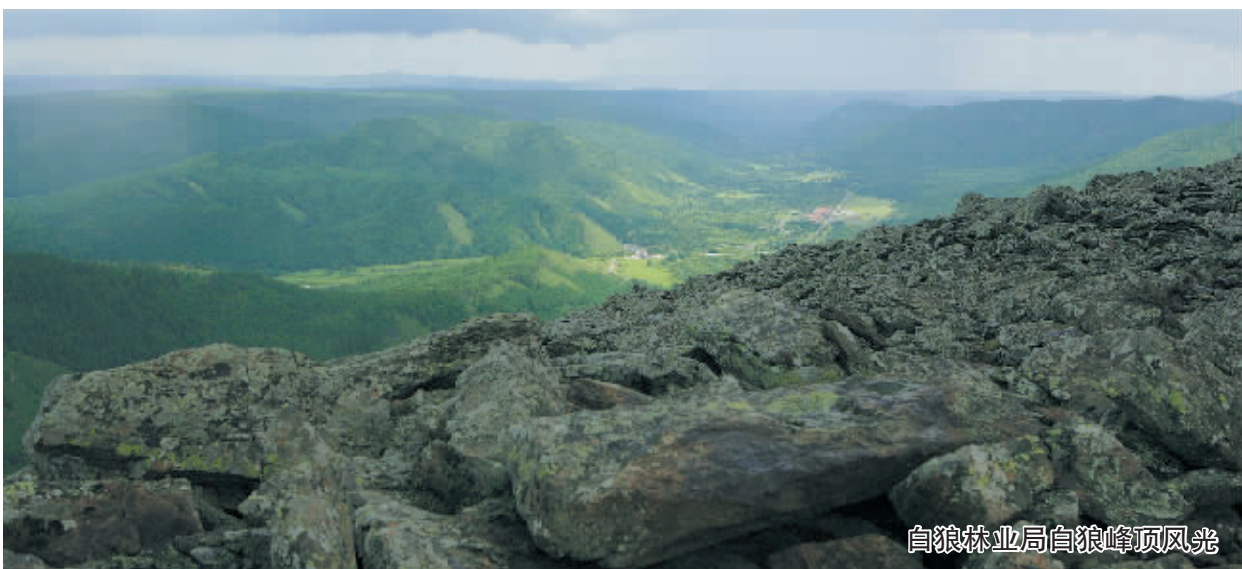
白狼林业局白狼峰顶风光