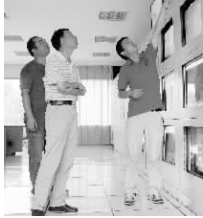
图为市城市污水处理厂的控制中心。