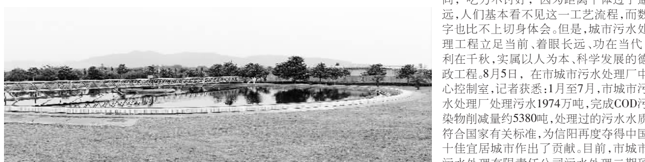
图为从氧化沟里经处理排出的污水进入沉淀池进行二次沉淀达到上清液(中水)标准的场景。

产生活污水经过中心城区的主要排污管道的截污口,被提泵站提升后通过18公里的排污主干管,输送到城郊的市污水处理厂,经过粗格栅、细格栅被分别过滤掉直径大于0.8厘米、0.2厘米的渣滓,经沉砂池分离出细小砂砾,进入到氧化沟的污染物被吸收、分解、处理,排入沉淀池进行沉淀达到上清液(即中水)的标准再行排放或直排沙河。 获悉上述工艺流程,记者才明白城市污水处理工程“只花钱不见效益”的说法。显然,治理污水跟治理空气污染不同,吃力不讨好,因为距离个体过于遥远,人们基本看不见这一工艺流程,而数字也比不上切身体会。但是,城市污水处理工程立足当前、着眼长远、功在当代、利在千秋,实属以人为本、科学发展的德政工程。8月5日,在市城市污水处理厂控制中心,记者获悉:1月至7月,市城市污水处理厂处理污水1974万吨,完成COD污染物削减量约5380吨,处理过的污水水质符合国家标准,为信阳再度夺得中国十佳宜居城市作出了贡献。目前,市城市污水处理有限责任公司污水处理二期项目启动在即。届时,信阳市中心城区日处理污水能力将达到20万吨。