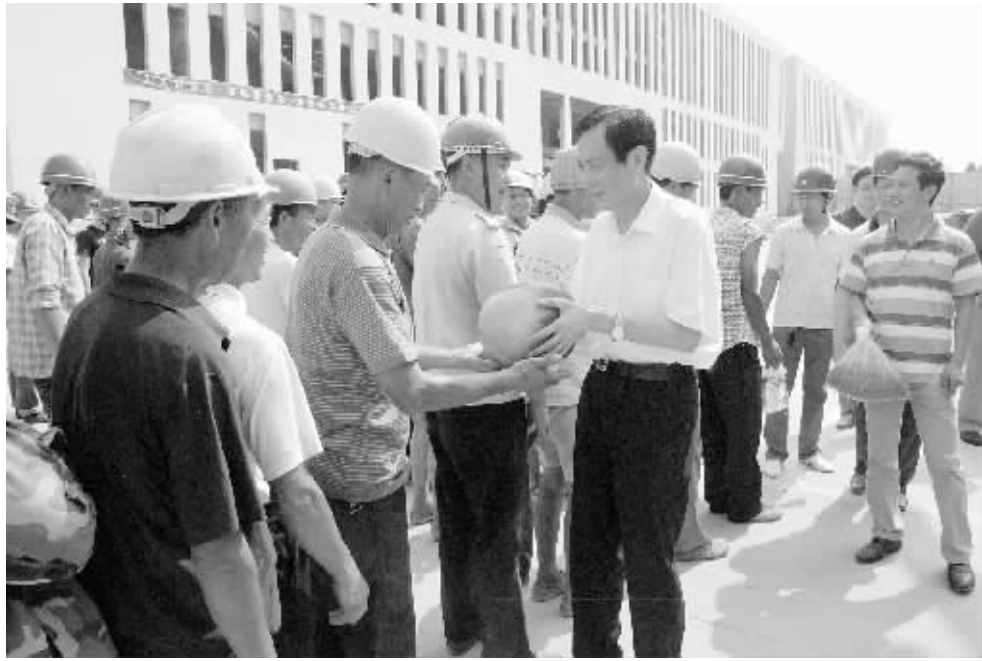
日前,市住建局负责同志深入到中心城区重点建设项目工地,看望慰问坚持在生产一线的建筑工人,并送去了西瓜、绿豆、矿泉水及防暑降温药品。

市人防办负责同志表示,地下空间规划应当符合国民经济和社会发展规划及城市总体规划,并与人民防空规划、地下交通规划、地下管线规划等专业规划相协调。为此,市人防办要在积极搜集相关法律法规,学习考察外地成功经验的基础上,加快信阳中心城市地下空间开发利用,一是建议政府立法,明确地下空间的权属关系;二是出台规划,为政府提供决策;三是建立机制,区分相关部门管理职责;四是搞好平战转换,确保城市防空安全;五是拓宽融资渠道,实现投资主体多元化,为加快信阳中心城市地下空间开发利用注入活力。