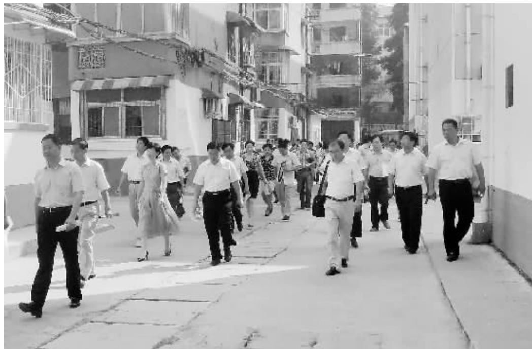
近日,市政府创卫摩团来到破产企业家属区,观摩浉河区车站办事处辖区创卫工作。

本报讯(毛鑫)入夏以来,浉河区市政管理执法局科学实施、防治结合,全力做好夏季园林病虫害防治工作,确保城市园林景观效果。 预警机制突出“早”。入夏前,该局组织园林技术人员对辖区道路绿化植物进行全面普查,针对不同树种及病虫害类别分别制定了科学的预警机制、治理方案,建立园林管