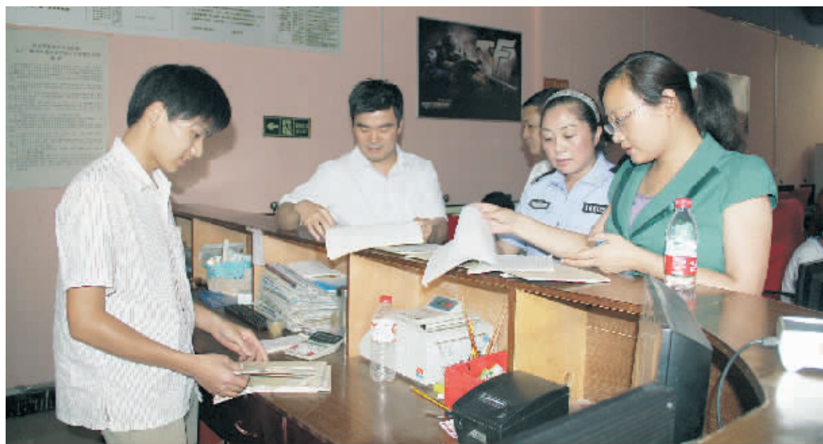
为给中小学生学习创造良好的暑期学习和生活环境,淮滨县公安局切实加强网吧监管,严厉打击各种违规行为。图为该局网监部门工作人员会同文化执法单位现场检查网吧时的情景。

五是领导高度重视。在今年的报名工作中,该局及时成立了国家司法考试工作领导小组,提出了“把握政策要准,工作标准要高,申报材料要细,服务意识到位”的总体要求,该局局长雷丽萍多次亲临服务现场,检查指导网上报名和现场确认的工作情况,及时解决报名工作中存在的实际困难和问题。二是宣传工作到位。该局开通国家司法考试咨询热线电话,利用报纸、电视、网络等各类媒体,对国家司法考试的有关政策以及报名时间、地点进行广泛宣传。在现场确认点挂横幅,张贴报名须知、《国家司法考试应试规则》等,使广大考生全面了解国家政策和规定。三是政策把关严格。该局对现场确认工作提出零失误、零差错、零事故、零投诉的目标,组织工作人员进行集中培训,明确工作岗位、职责范围和具体要求,严把异地报名关,仔细核对享受放宽地方政策的报名人员应提供的材料,以及应届毕业生报名时应符合的条件,确保严格按照司法部和省司法厅的有关规定执行。四是热情服务考生。该局热情接待每一位考生,在市行政审批中心设立服务窗口,抽调专门人员,配备专用设备,为考生提供初审、复审、照相、复核等整个报名流程“一站式”服务,平均每位考生报名时不超过20分钟,保证了现场确认工作快捷高效、规范有序和准确无误。