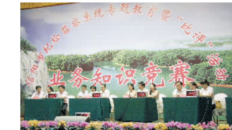
昨日下午,全市纪检监察业务知识竞赛复赛在市行政中心六号楼会议室举行。市纪委从今年3月份开始在全市纪检监察系统开展以比学习、比工作、比形象为主要内容,以“比一比、评一评”活动为主要载体的能力型队伍建设活动,旨在促进纪检干部熟练掌握纪检监察工作规则和方法,提高业务能力。图为比赛现场。

此次峰会旨在为我国内衣家居服行业相关企业、经销商搭建“交流、学习、合作”的平台,加快产业增长模式的转变,进一步推动该行业有序健康发展。为参加此次峰会,该区做了精心准备。一是明确专人负责,制定工作方案。成功邀请到中纺协常务副会长、内衣、家居服委员会会长彭桂