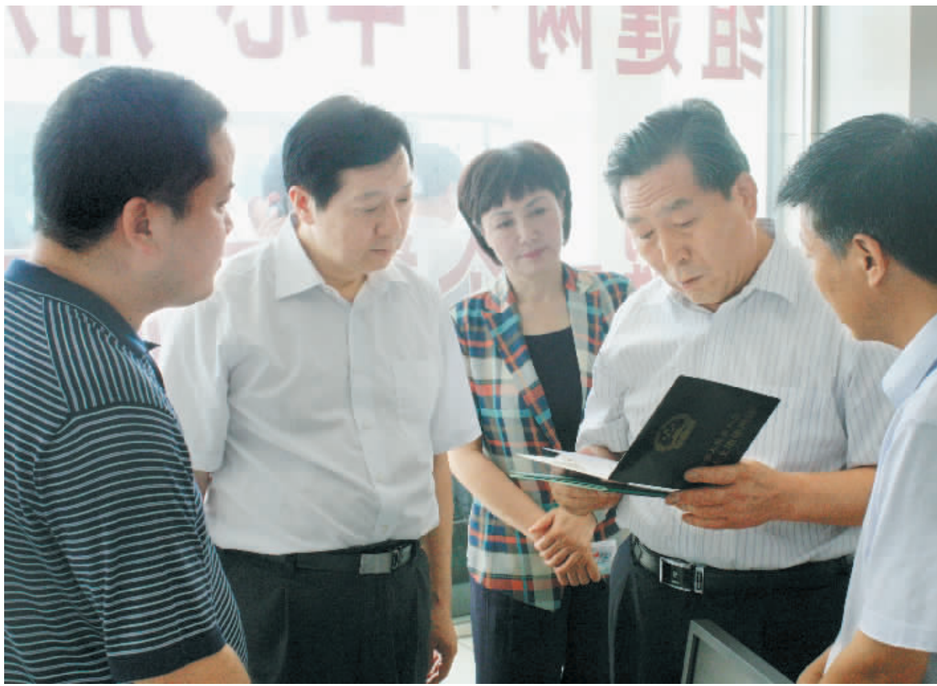
图为史济春(右二)一行在郭瑞民等陪同下,在平桥区陆庙村新型农村社区信用担保物权交易服务功能区视察工作。

本报讯(记者 曹新俊)7月11日,省委常委、省委统战部副部长史济春,省委统战部常务副部长孟令峰,省委统战部副部长、省侨联党组书记邹文珠一行来到我市,就统战工作、新型农村社区建设等进行调研。中石化河南石油分公司总经理田中山等陪同调研。